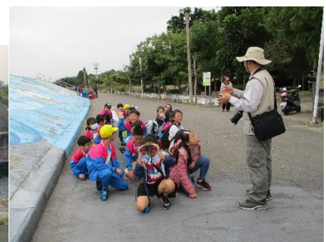
照片說明: 帶領學生實際到荖藤社區踏查, 了解防洪防汛的設施, 由社區發展協會及野鳥協會的人員進行導覽解說。