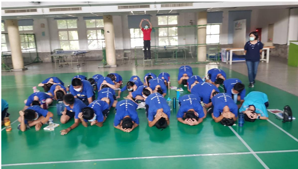
照片說明：實際操演 趴下、掩護、穩住等 3 防災步驟