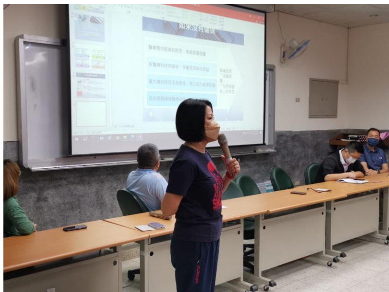
照片說明：召開防災演練會報，校長及學務處確認各組職責及相關負責之先前作業及工作