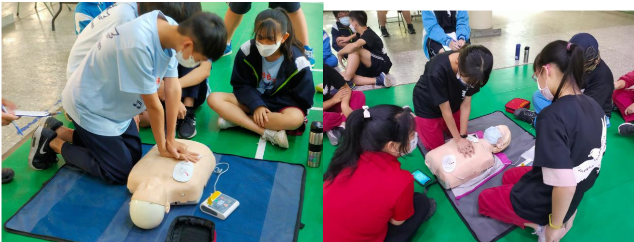
照片說明：學生實作