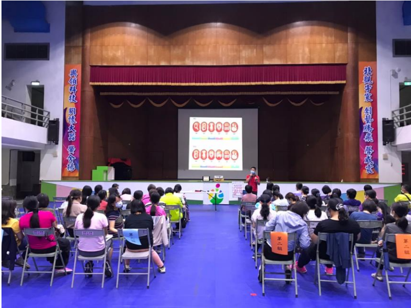
照片說明：CPR+AED 訓練(教師篇)