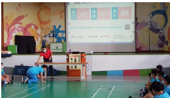
照片說明：後湖分隊對學生實施趴下、掩護、穩住等 3 防災步驟實際操演