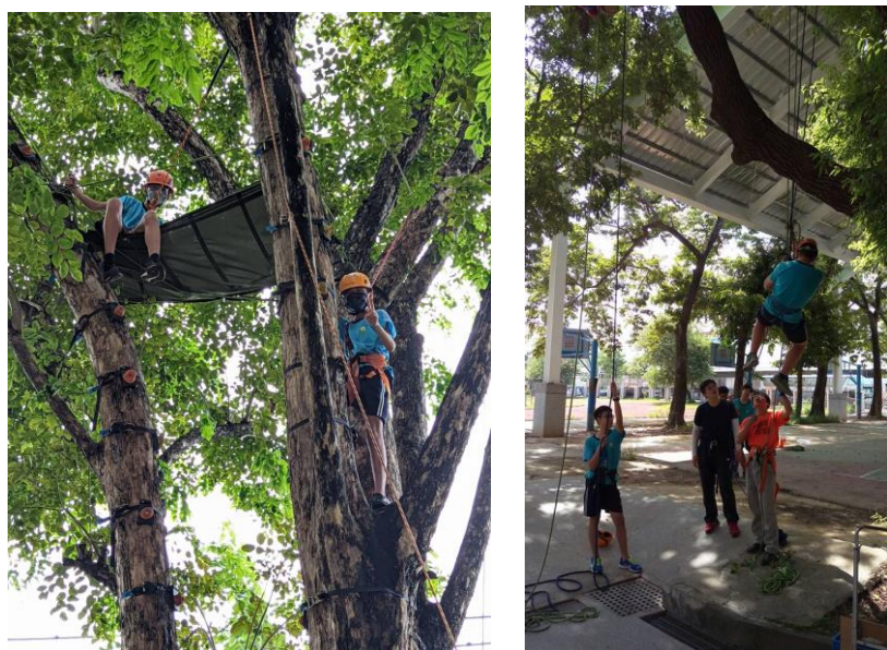
照片說明：登高垂降體驗(學生組)