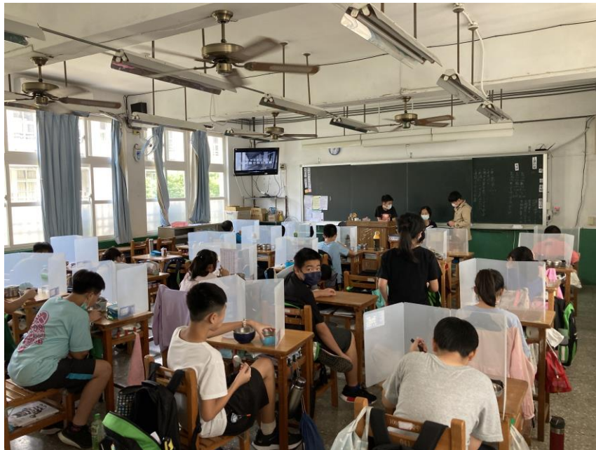
照片說明：在午餐時間，利用電視廣播播放防災短片宣導防災保命之3要領