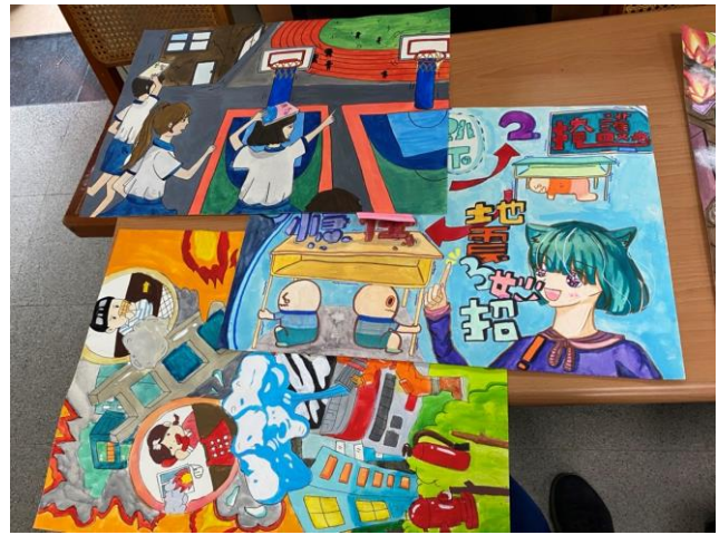
照片說明： 挑選優秀作品，登記嘉獎鼓勵