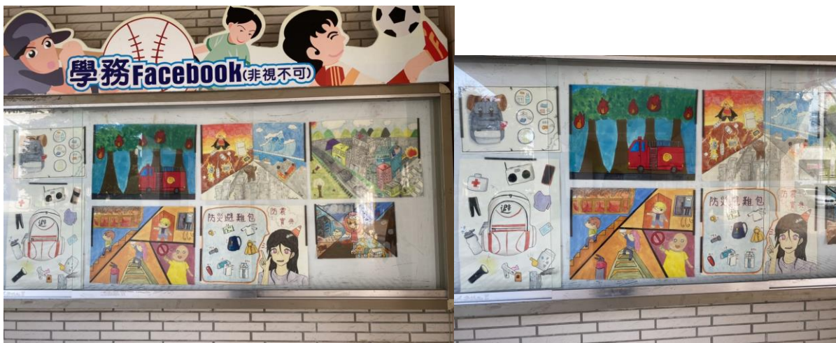
照片說明： 各班作品輪流張貼於學務處公告欄展示