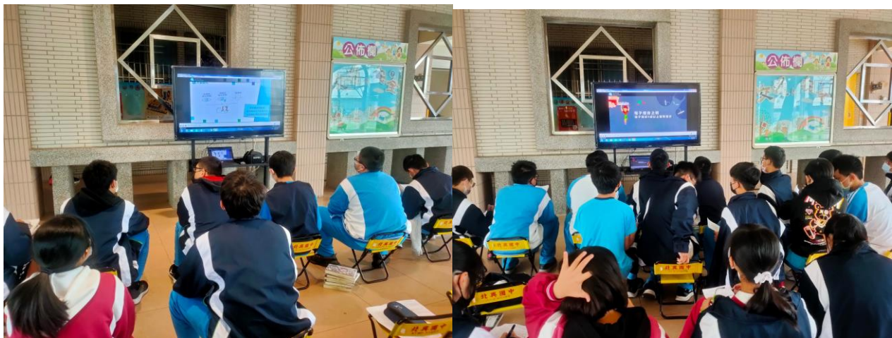
照片說明：以健康檢查的時間，利用電視播放防災短片宣導 趴下、掩護、穩住等 3 防災步驟