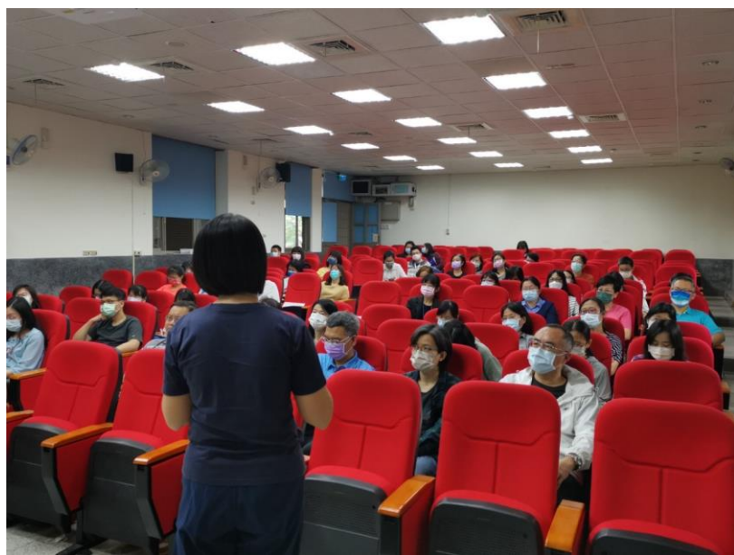
照片說明：召開防災演練會報，校長及學務處確認各組職責及相關負責之先前作業及工作