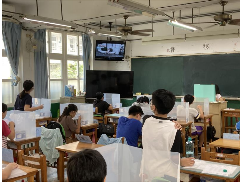
照片說明：在午餐時間，利用電視廣播播放人為災害短片宣導當災害發生時如何因應