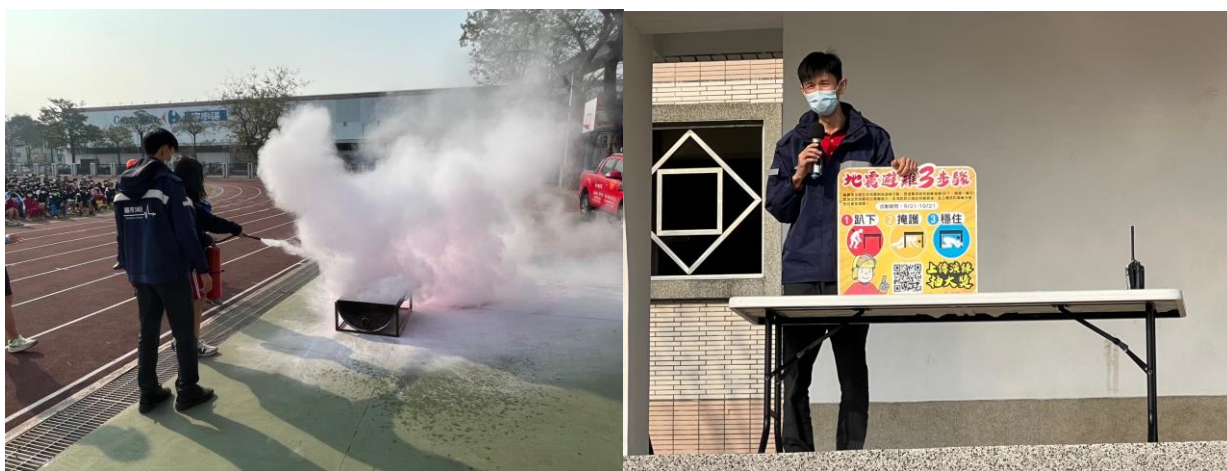
照片說明：後湖分隊對學生宣導防火防震知識