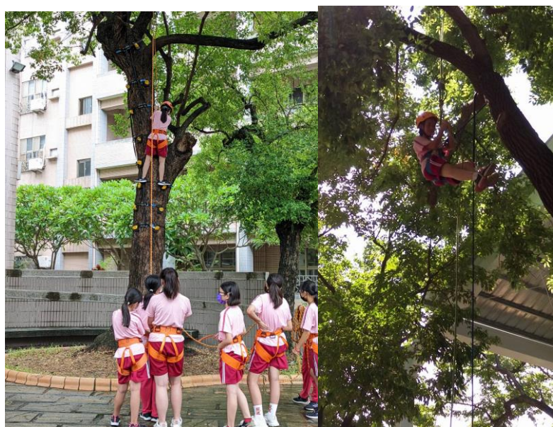
照片說明：登高垂降體驗(學生組)