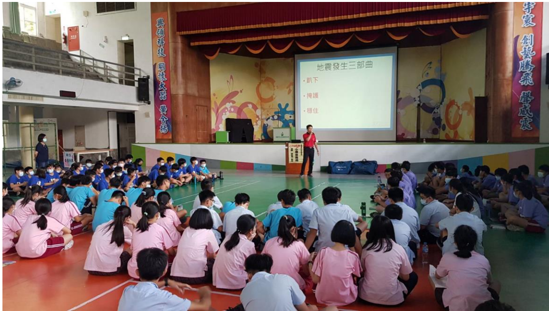
照片說明：後湖分隊小隊長對學生宣導 趴下、掩護、穩住等 3 防災步驟