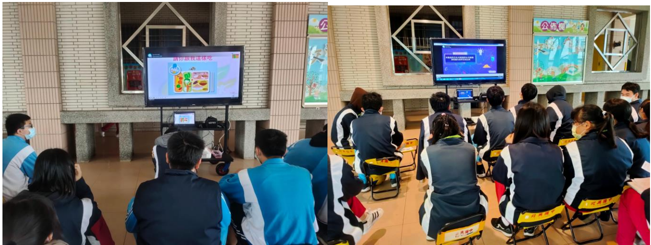
照片說明：以健康檢查的時間，利用電視播放防災短片宣導 趴下、掩護、穩住等 3 防災步驟