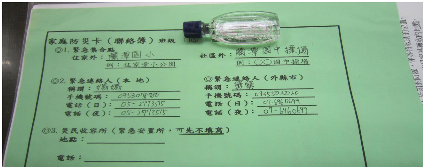
照片說明：：學生黏貼在聯絡簿上的防災卡與 1991 留言平台