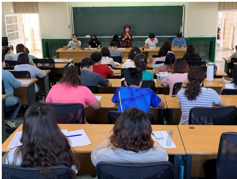
全校教職員工參與防災工作會議。