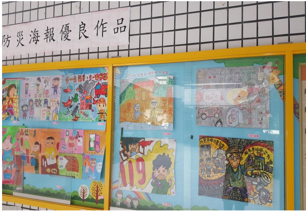
防災海報優良作品欣賞