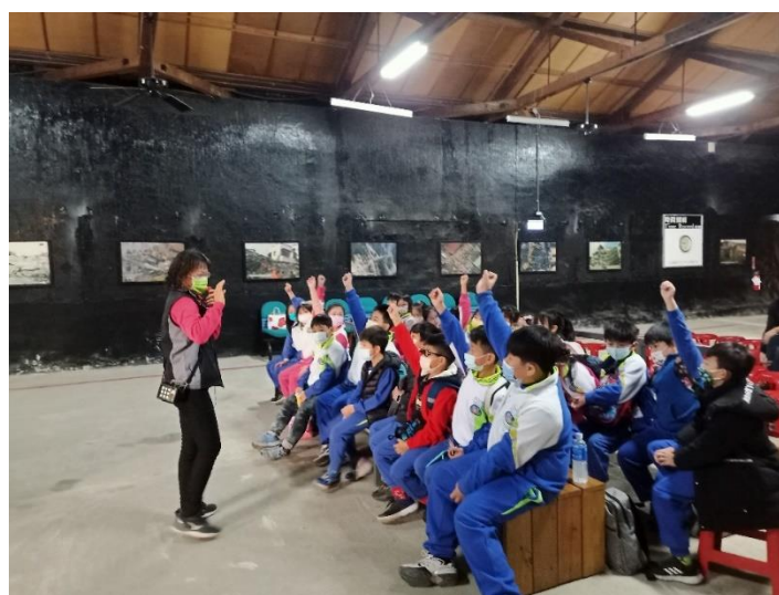
有獎徵答-學生踴躍舉手回答