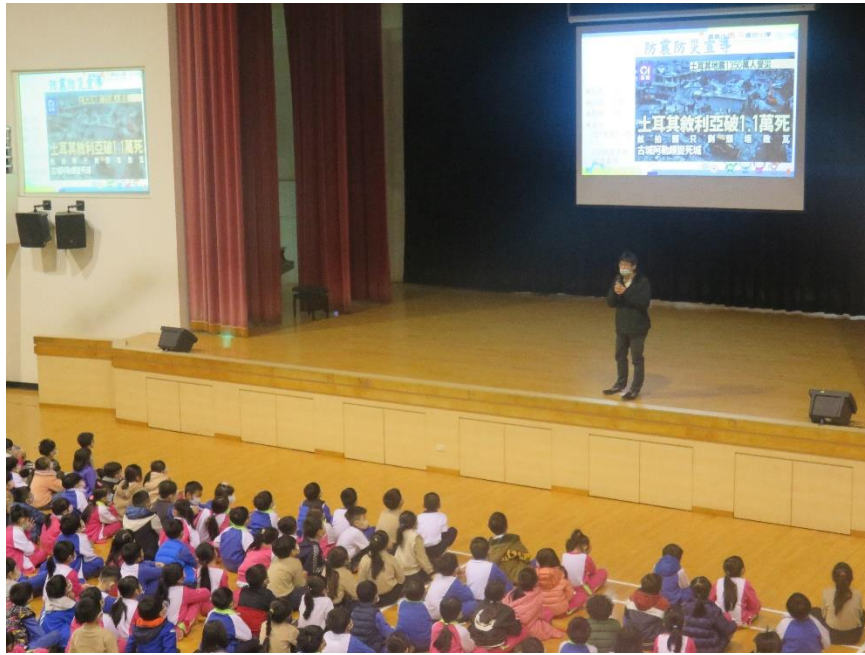
照片說明： 利用期初始業式做防災宣導-以土耳其大地震為例