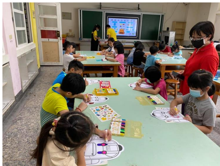
照片說明： 製作自己的防災避難包