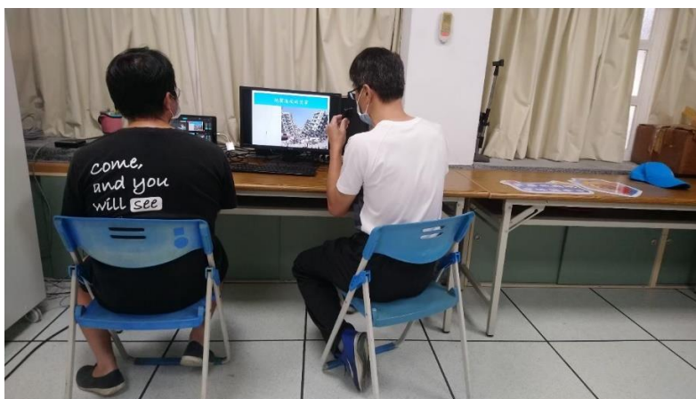
照片說明：111學年度第一學期始業式防災宣導-地震災害的恐怖