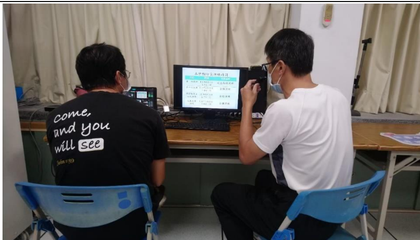
照片說明：111 學年度第一學期始業式防災宣導-說明本學期防災演練時間