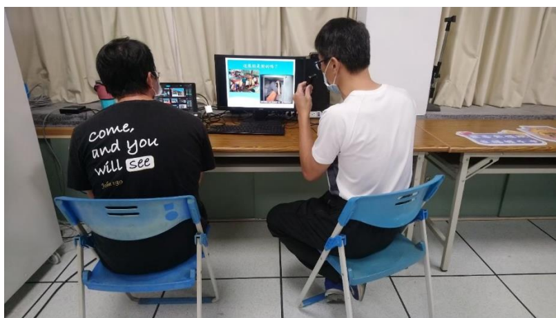
照片說明：111學年度第一學期始業式防災宣導：辨認錯誤的防災動作