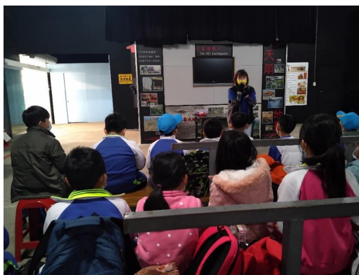
導覽員跟學生說明觀看地震宣導影片前之注意事項