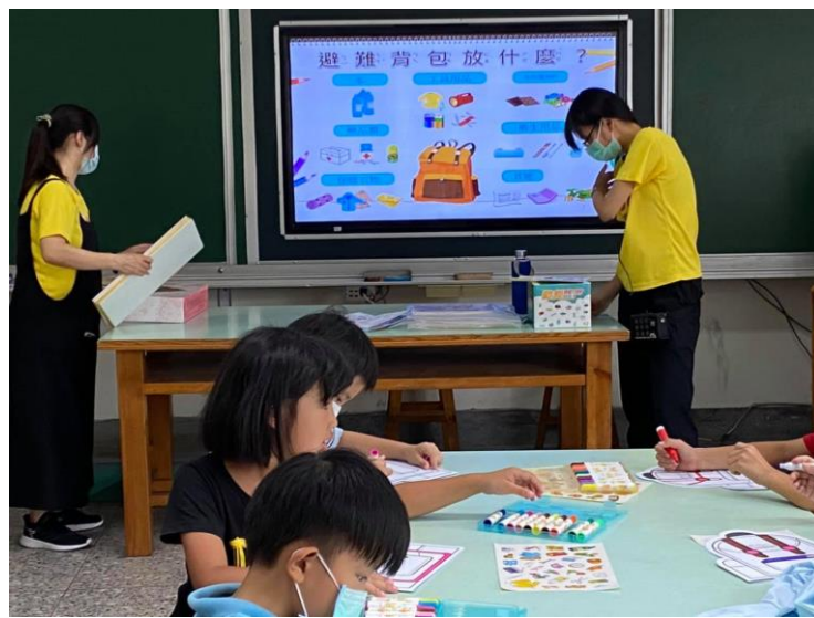
照片說明： 避難背包放什麼？