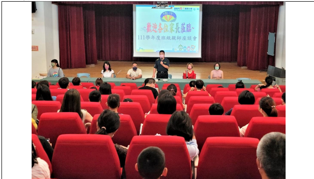
111 學年度第一學期班級親師座談會