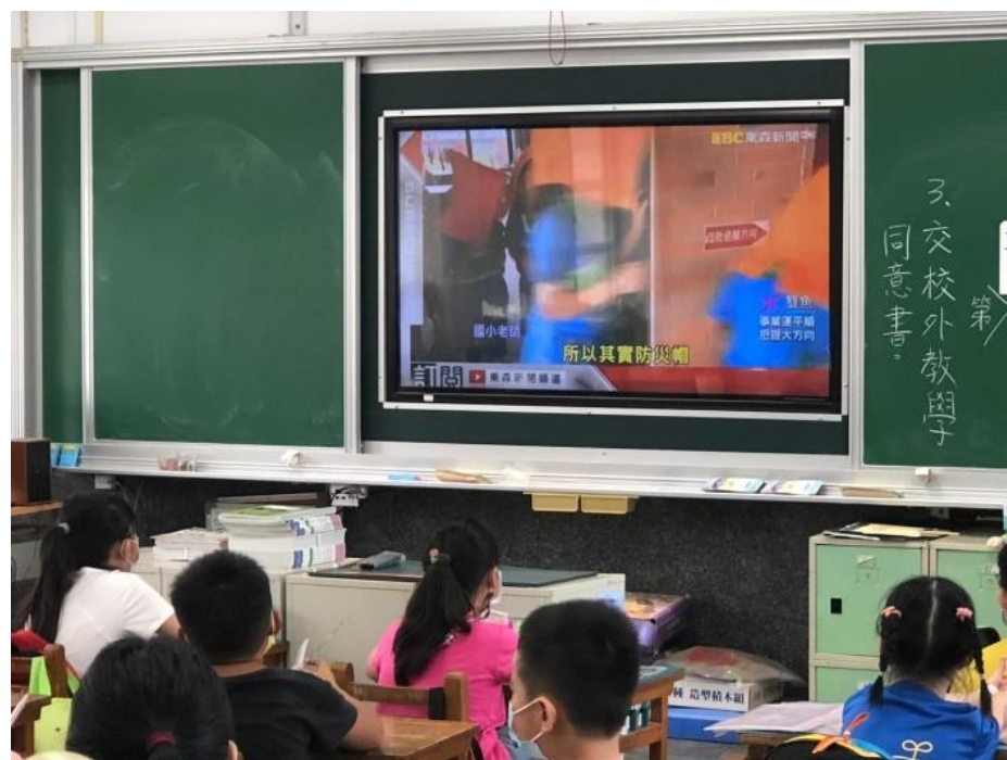
照片說明：教職員及學生在教室看視訊宣導