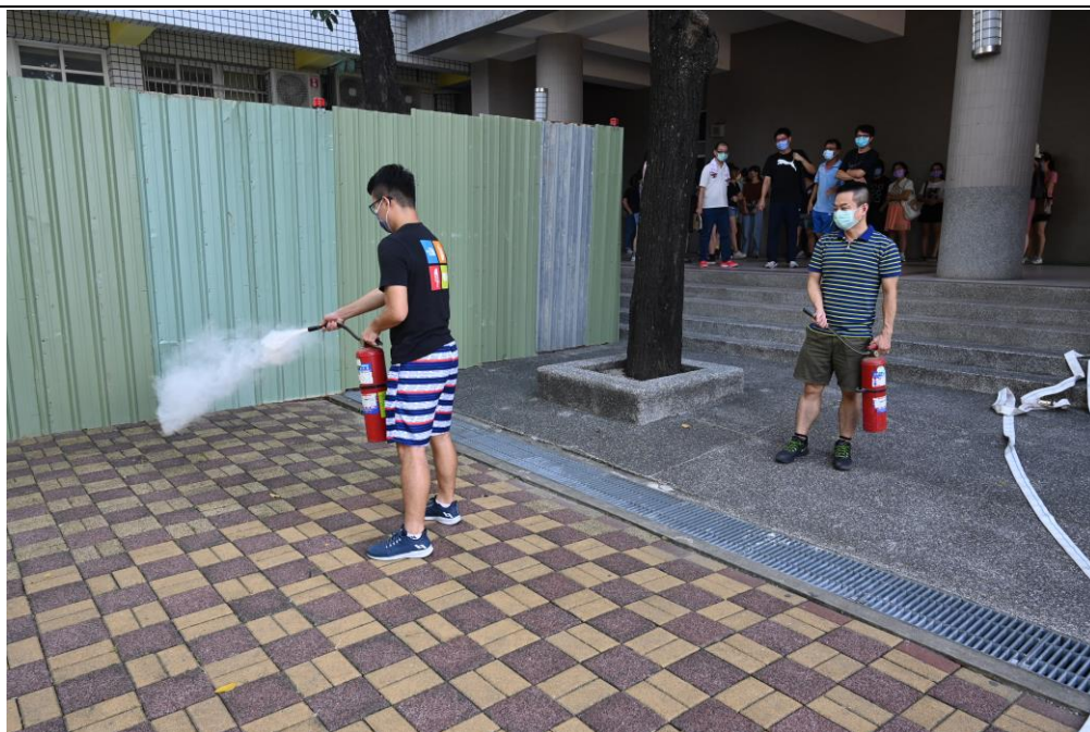
火災分析與消防觀念建構與操作