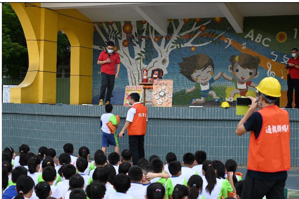
德安消防分隊蒞校進行防災防震教育宣導-有獎徵答