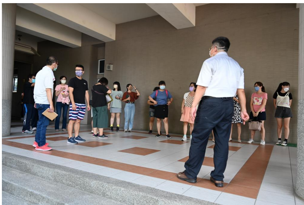
自衛消防編組現況-自衛消防編組宣導