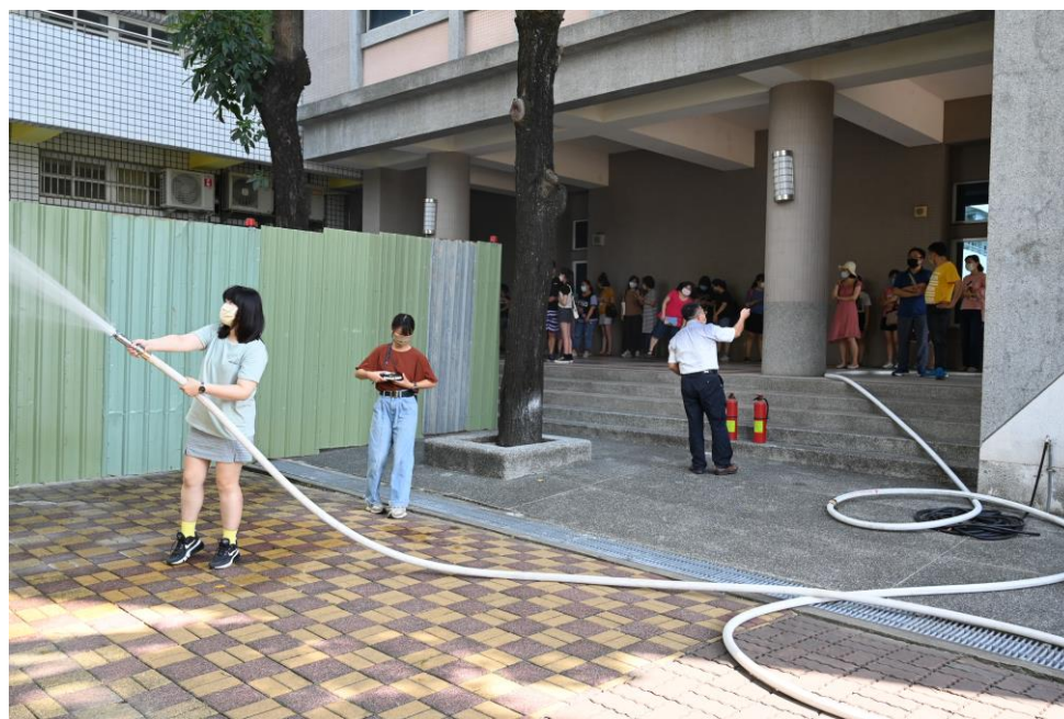
消防設備操作與學習