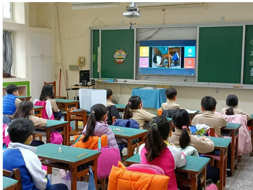
照片說明：學生在教室內觀看視訊宣導