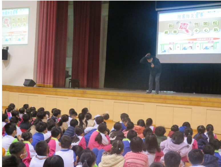
照片說明：宣導防震避難不慌張，做出正確的DCH動作保平安