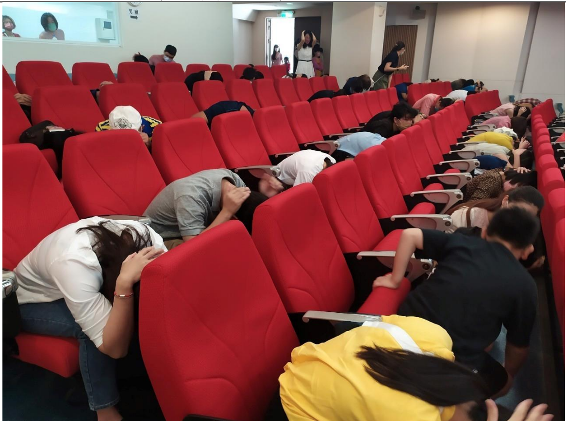
111 學年度第一學期班級親師座談會 家長、學生做出正確防震避難動作