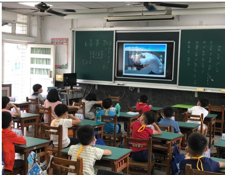
照片說明：教職員及學生地震保命三步驟正確動作說明與防災頭套使用