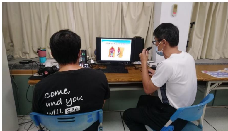
照片說明：111學年度第一學期始業式防災宣導-防災頭套的使用