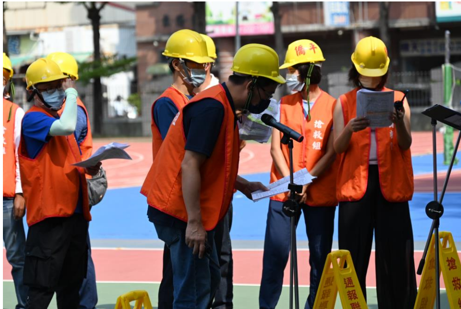
自衛消防編組現況-自衛消防編組宣導