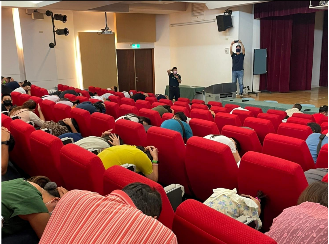
111 學年度第一學期班級親師座談會 校長邀請現場家長、學生做防震避難動作