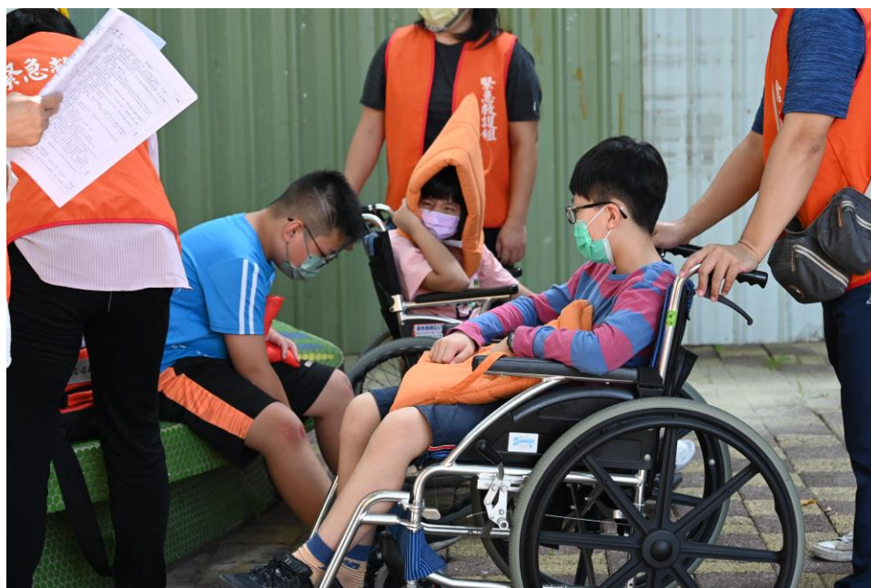
災害逃生演練與救護包紮