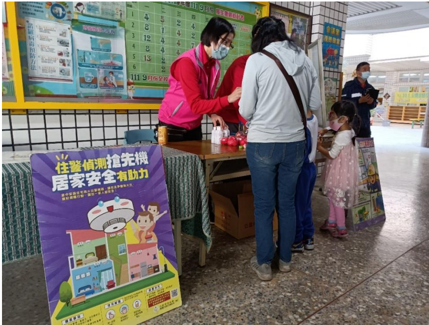
德安消防分隊熱心向家長宣導電器防災-鼓勵住家安裝住警器