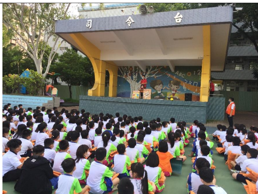
德安消防分隊蒞校進行防災防震教育宣導-如何準備緊急避難包內容物