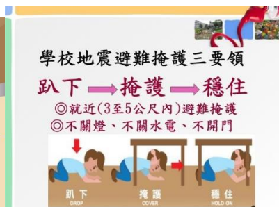
照片說明：111學年度第2學期始業式簡報內容