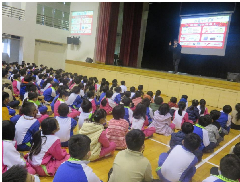
照片說明： 說明防震避難包內容物