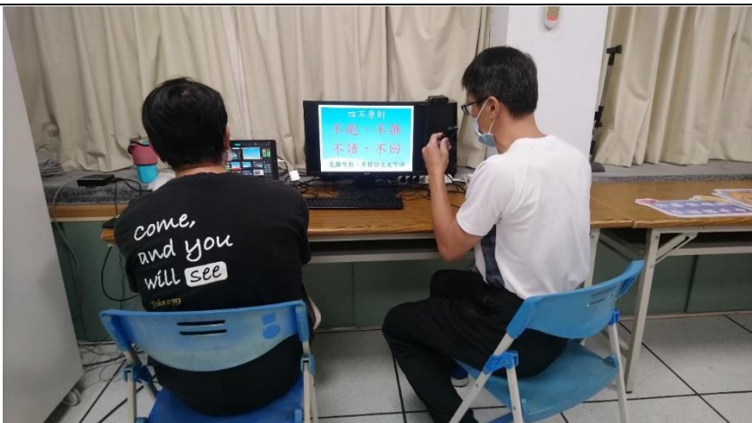
照片說明：111 學年度第一學期始業式防災宣導：提醒學生疏散四不原則