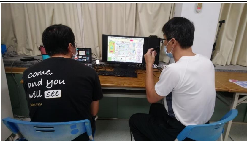
照片說明：111 學年度第一學期始業式防災宣導：說明各年級疏散路線