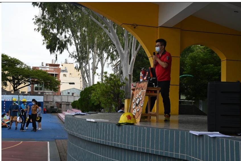
德安消防分隊蒞校進行防災防震教育宣導-滅火器的使用與時機