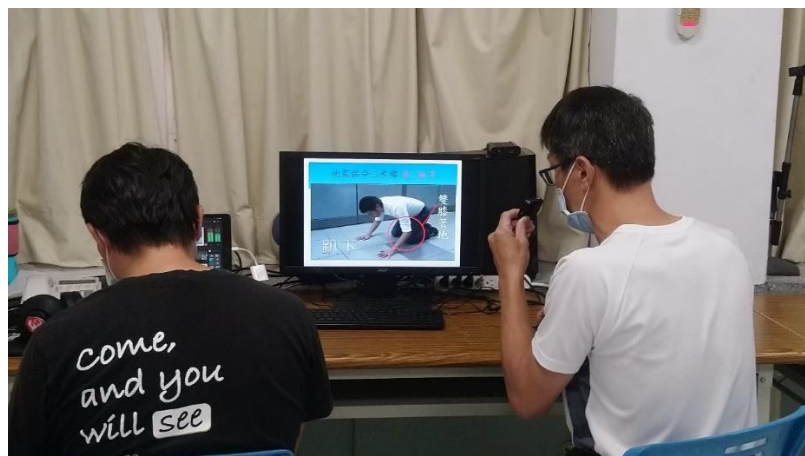
照片說明：111學年度第一學期始業式防災宣導地震保命三步驟:趴下、掩護、穩住