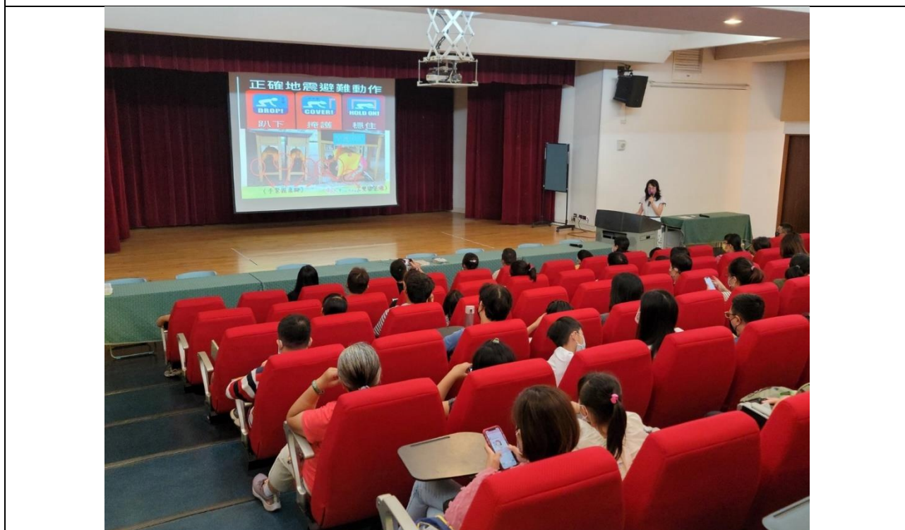
111 學年度第一學期班級親師座談會-宣導防震避難三步驟