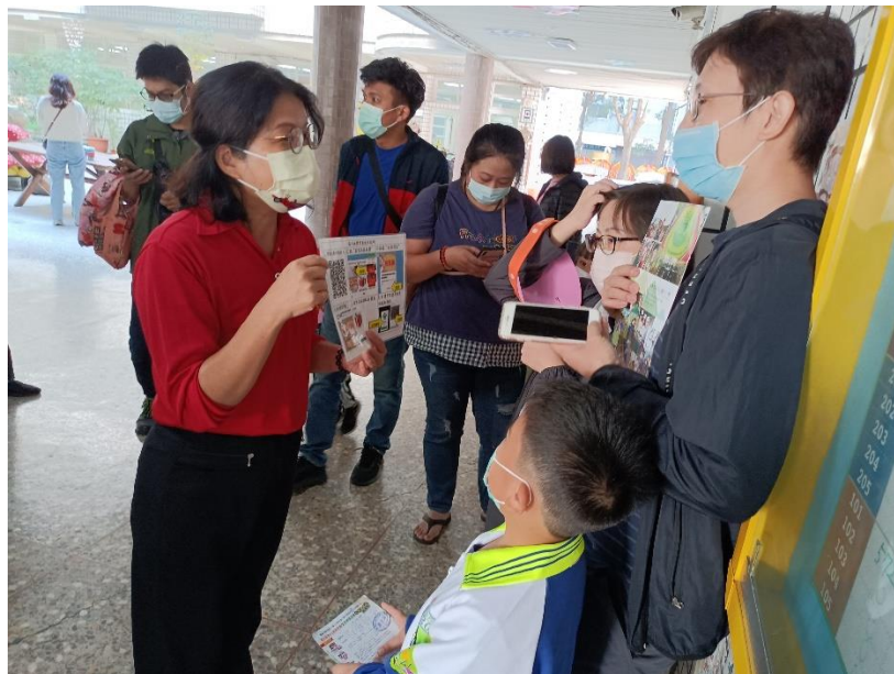
德安消防分隊宣導電器防災宣導-鼓勵住家安裝住警器