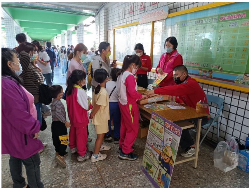
家長與學生在消防隊員的引導下學習電器防災新知