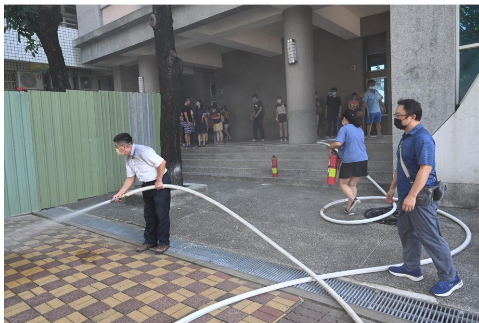
消防設備操作與學習