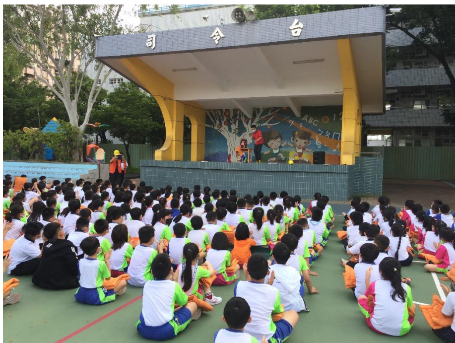
德安消防分隊蒞校進行防災防震教育宣導-請學生示範趴下、掩護、穩住