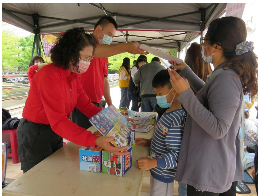
家長與學生在消防隊員的引導下學習防災新知