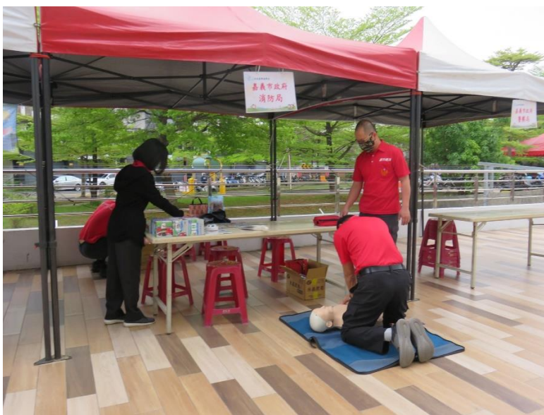
德安消防分隊響應文藝芳鄰活動-設 CPR 教學闖關活動