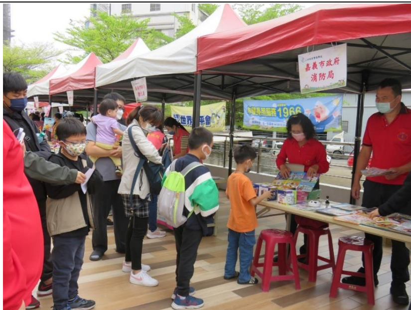
小朋友踴躍參與闖關活動