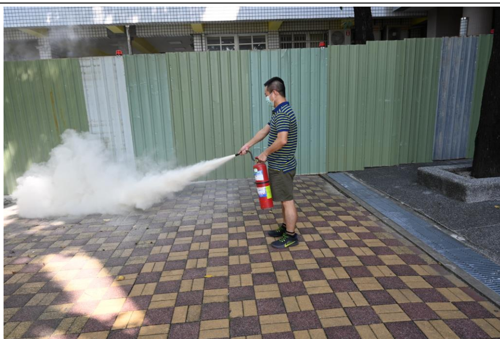
火災分析與消防觀念建構與操作