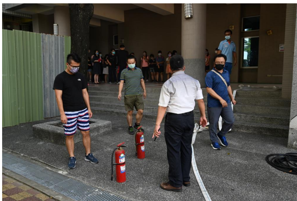
消防安全按理剖析與演練