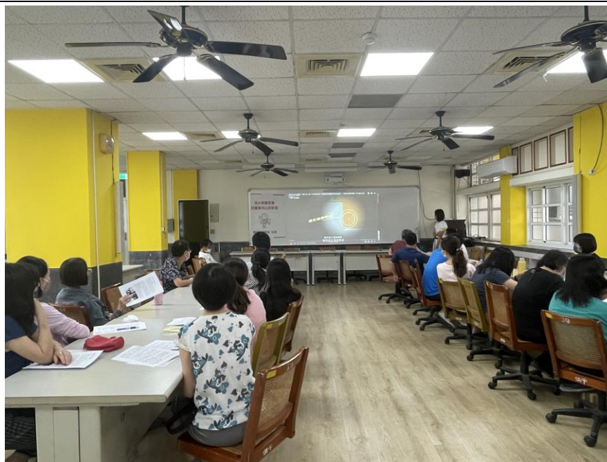
火災分析與消防觀念建構與操作宣導