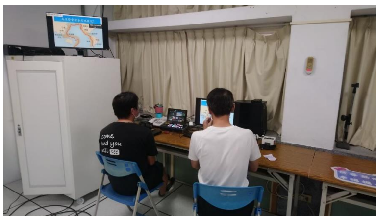
照片說明：111學年度第一學期始業式防災宣導-向學生說明台灣多地震的原因