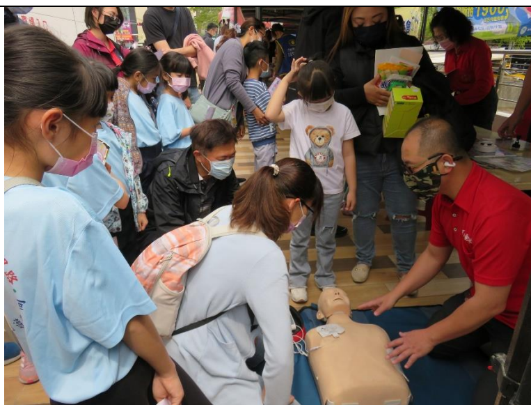
家長與學生在消防隊員的教導下踴躍嘗試心肺復甦術