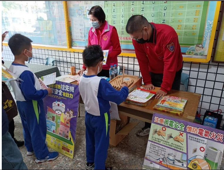
德安消防分隊響應第 63 屆校慶低碳園遊會活動-設站闖關活動