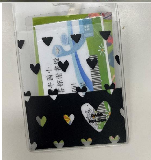
照片說明：家庭防災卡名片化—隨身帶