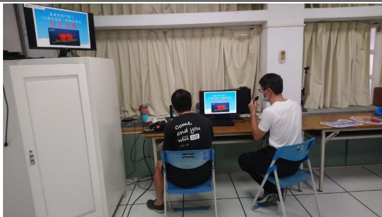
照片說明：111學年度第一學期始業式防災宣導