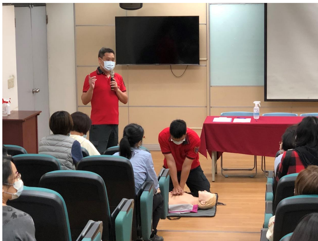
照片說明：教官示範 CPR 姿勢，教師實地操作 CPR