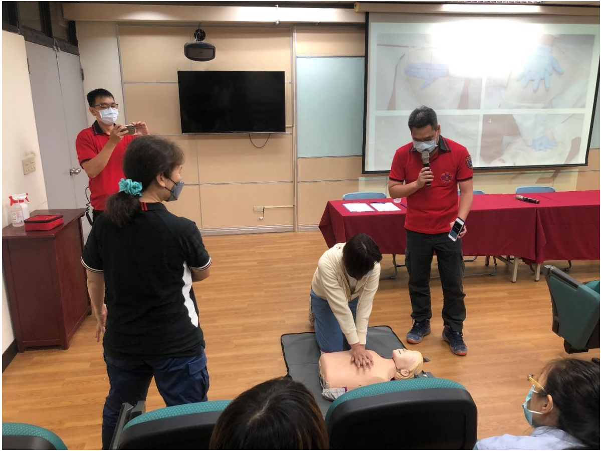
照片說明：每位教師實地操作 CPR