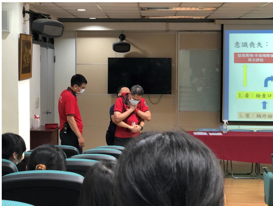
照片說明：消防局教學教官講解哈姆立克法重要步驟