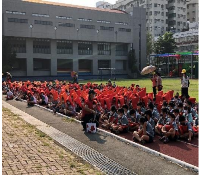
照片說明：嘉義市消防局第二分隊待本校演練結束後，於操場進行防震教育宣導