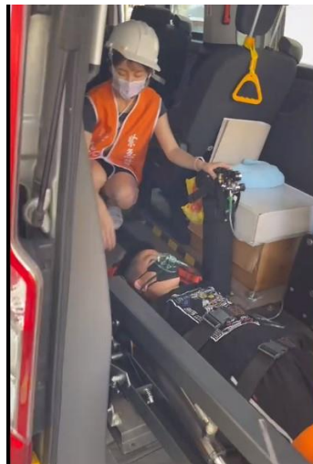
照片說明：複合型防災演練-受傷學生救護包紮