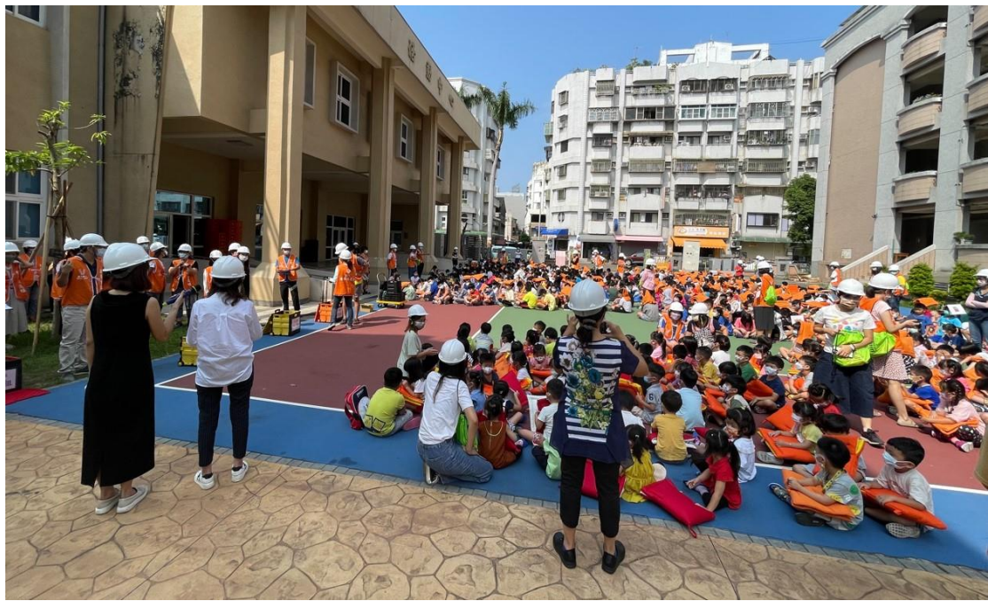
照片說明：緊急應變小組集合整裝待命