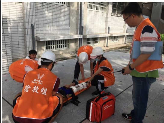
救護擔架/無線電/醫藥救護包