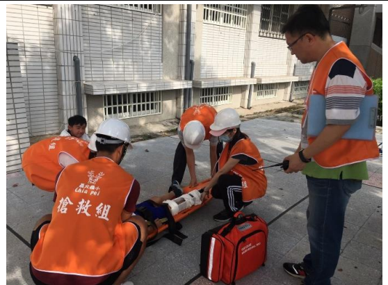
救護擔架/無線電/醫藥救護包