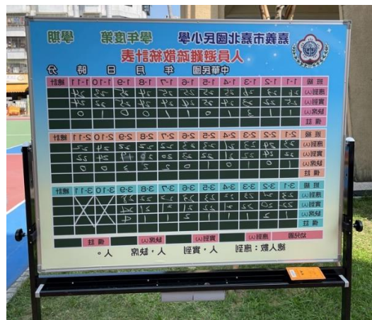
照片說明：學生集合於避難所後，各班進行人數清點並回報集合人數。