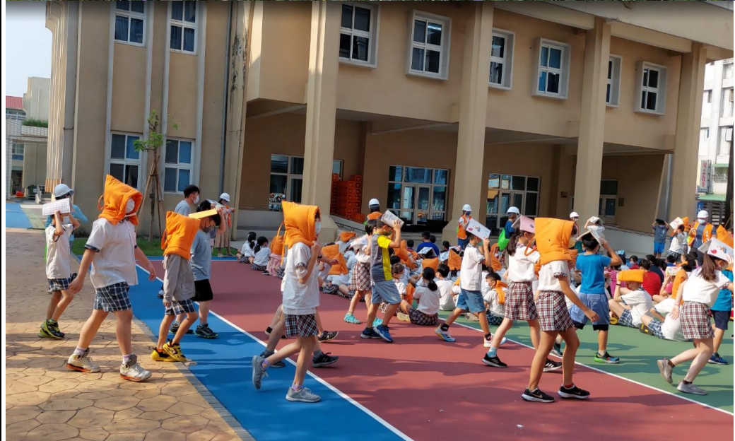
說明:師生保護頭頸部，聽從避難引導人員指揮，安靜且迅速地前往避難所集合。