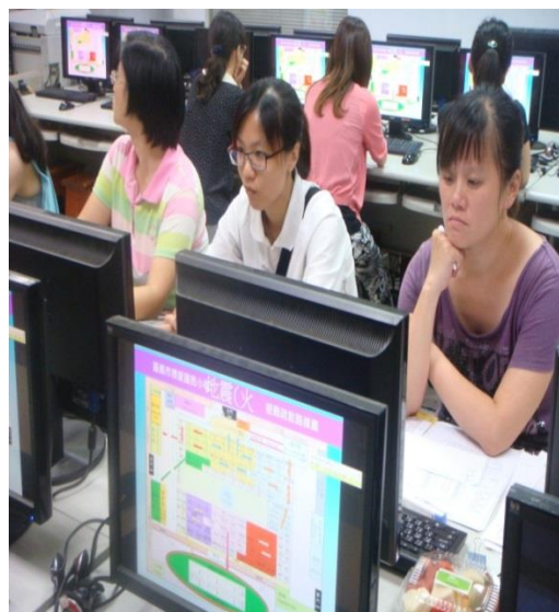
教師團隊成長工作坊之各學年教師。教師使用 MOE 防災教育數位平台設計教案。