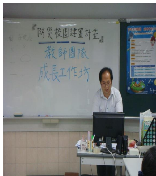
教師使用 MOE 防災教育數位平台設計教案。