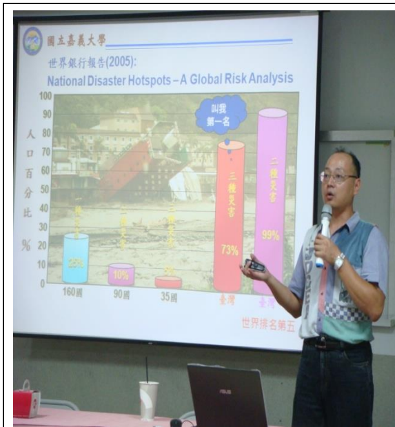
說明：教授講解天然災害及統計數據資料。