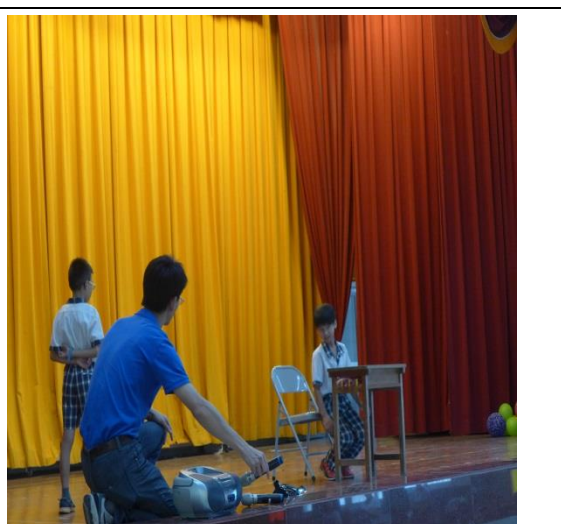
學生示範主震來時就地「趴下」的動作要領。