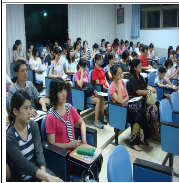
說明：本校教師研習專注，學習認真。