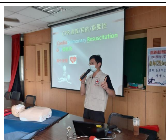
講師主講 CPR、AED 的使用時機與重要性。