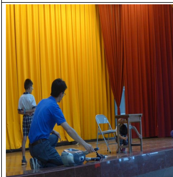
學生示範主震來時，就地「掩護」的動作要領。