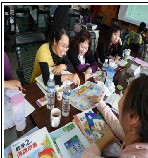
教師們進行防災地圖繪製的討論過程。