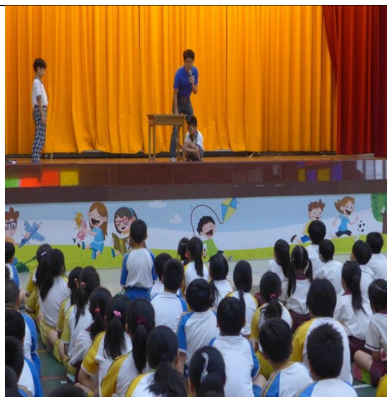
學生示範主震來時，「穩住」的動作要領。