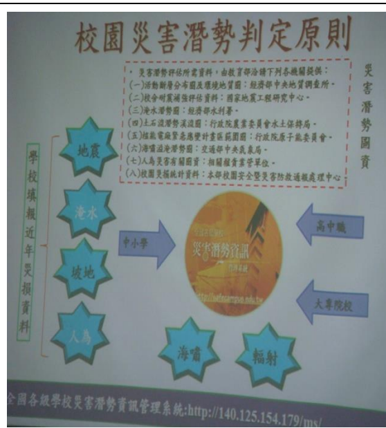
說明：教授講解校園災害潛勢判定原則。