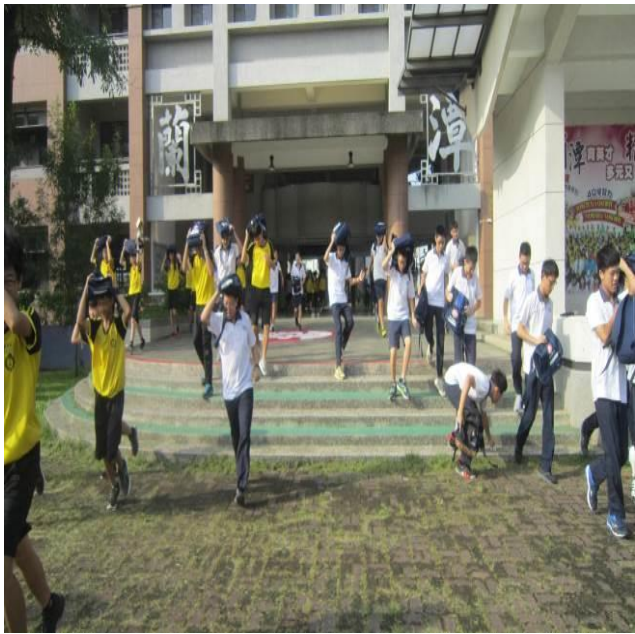
照片說明：已糾正在避難過程有物品掉落不要撿