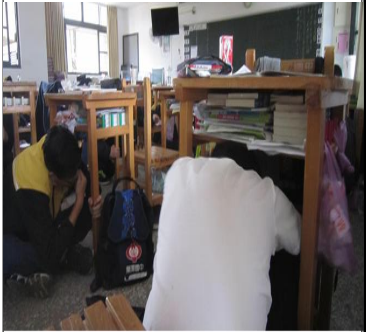
照片說明：美術班女生避難掩護動作較確實