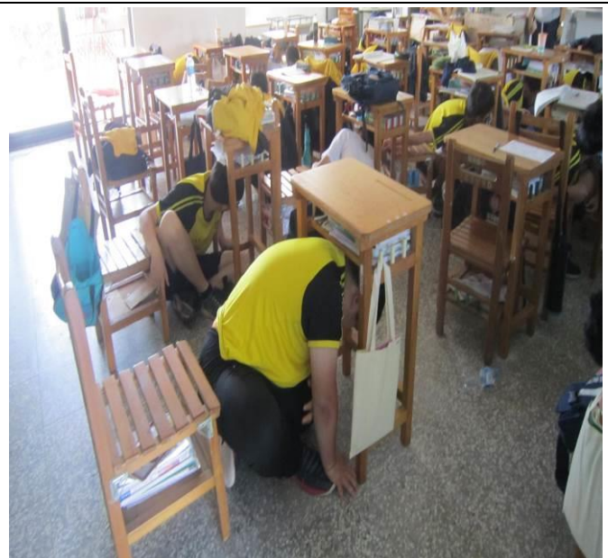
照片說明：避難掩護