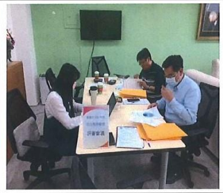
說明：委員進行教案評選