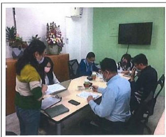
說明：評選工作報告說明