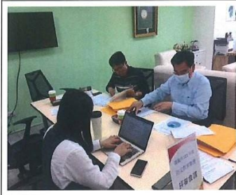
說明：委員進行教案評選