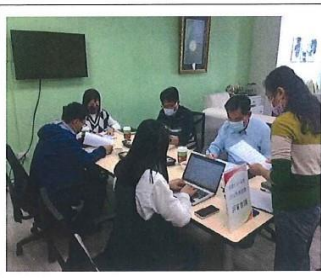
說明：評選工作報告說明