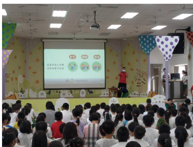
照片說明：消防隊員進行防災宣導，學生示範。