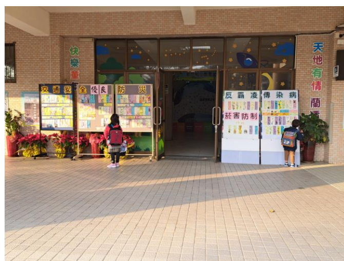
照片說明：達觀樓外展示學生防災書籤作品