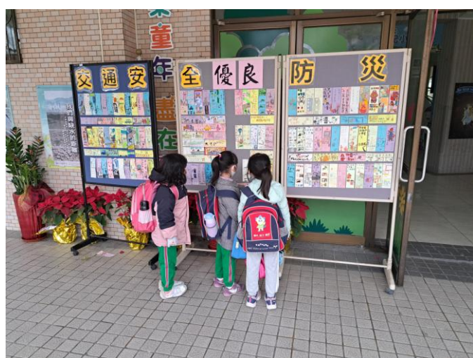
照片說明：達觀樓外展示學生防災書籤作品