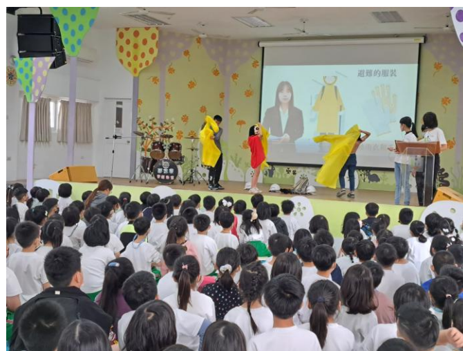
照片說明：防颱防災宣導