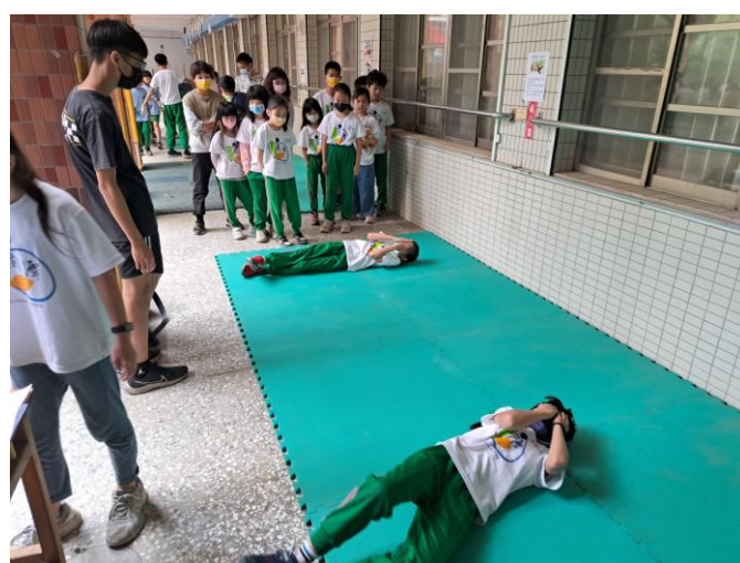
照片說明：衣服著火之滅火動作練習。