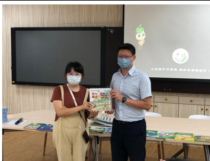
照片說明：校長與宣導人員合影。