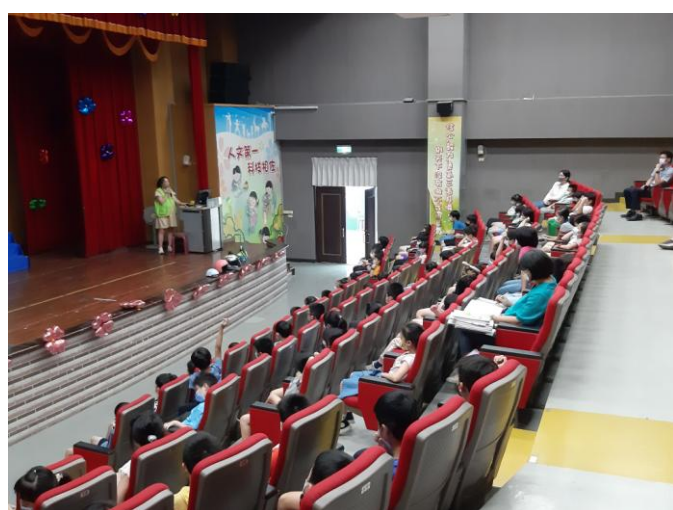
照片說明：校長也到場聽講。