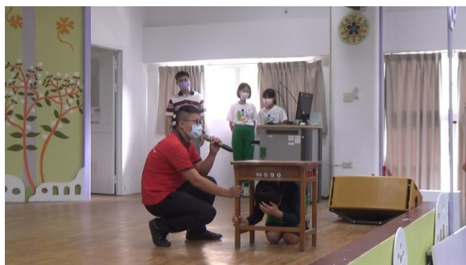
照片說明：消防隊員講解趴掩穩動作要領。