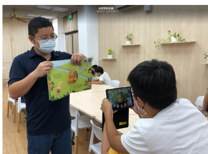
照片說明：學生進行闖關活動。