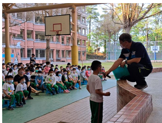
照片說明：於防火宣導中提問，讓學生發表觀點。