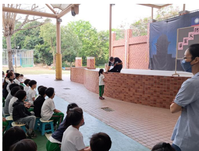
照片說明：清明節掃墓防火宣導---四不二記得