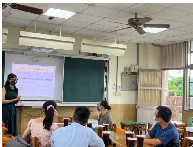
照片說明：向家長介紹 1991 報平安平台。