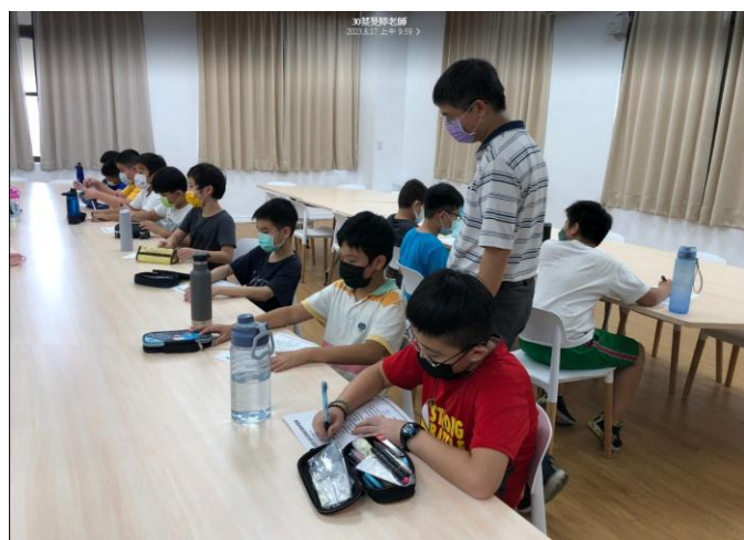
照片說明：學生填寫問卷。