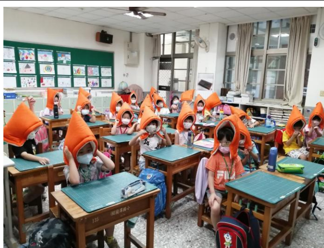
照片說明：新生模擬災害發生，進行練習。