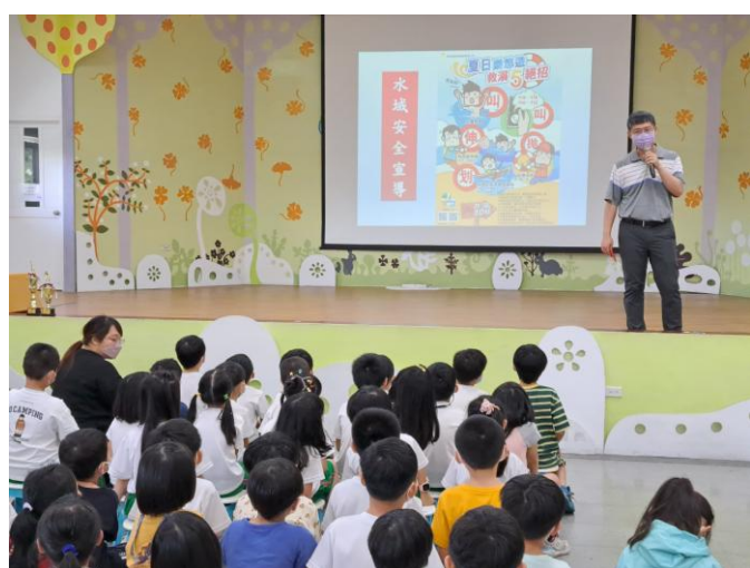
照片說明：水域安全宣導，介紹救溺 5 絕招。