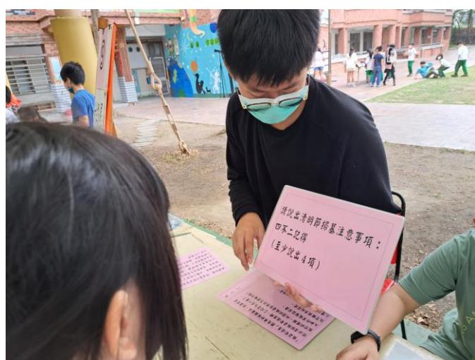
照片說明：請學生說出清明節掃墓注意事項之四不二記得。