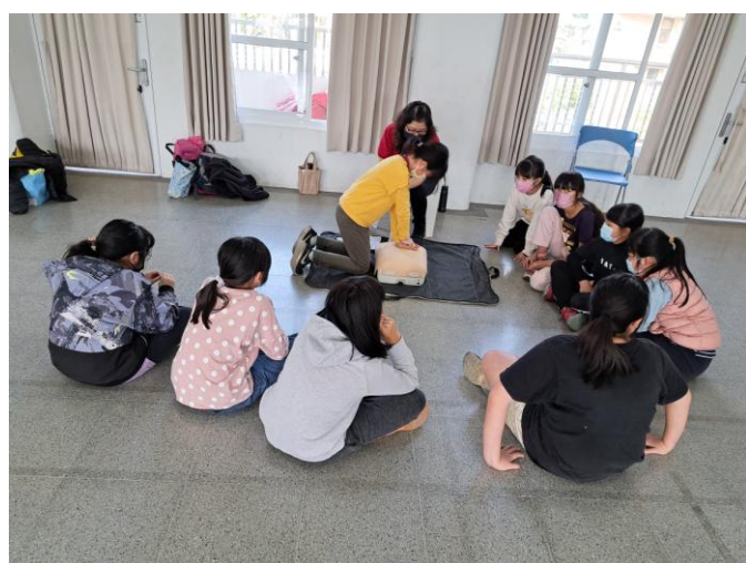
照片說明：CPR 的教學與認證