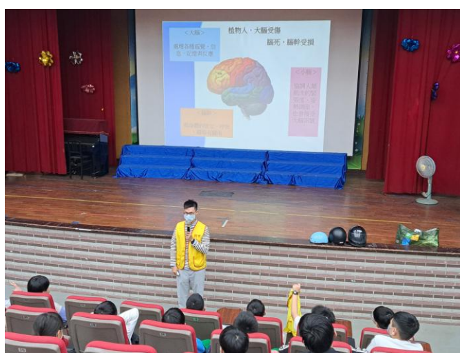
照片說明：課程介紹講解。