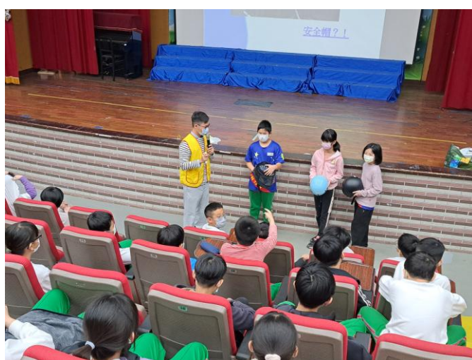
照片說明：學生認真聽講。