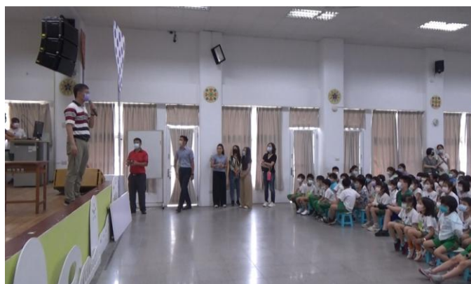
照片說明：學務主任為防災宣導開場。