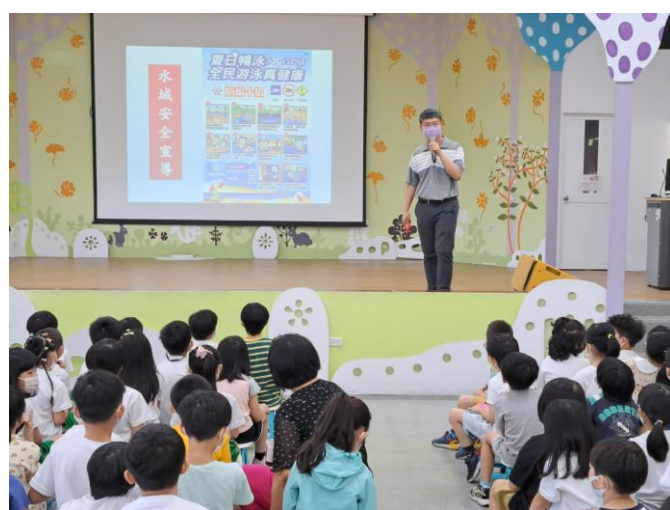
照片說明：水域安全宣導，介紹防溺水 10 招。