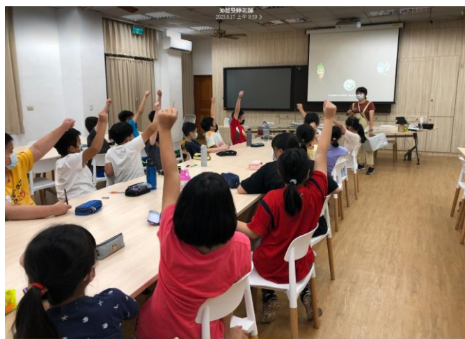
照片說明：學生認真聽講，踴躍回答問題。