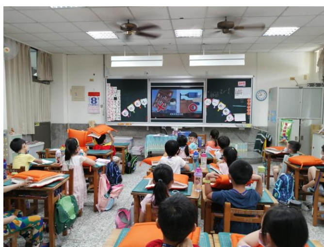
照片說明：新生各班於教室觀看防災影片。