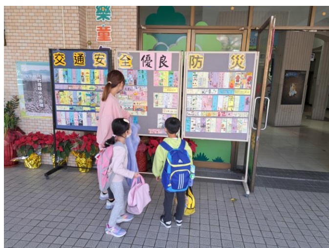
照片說明：達觀樓外展示學生防災書籤作品