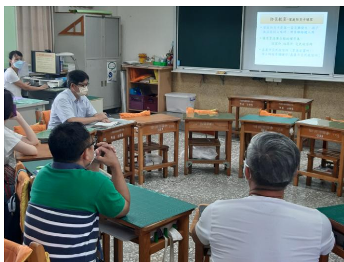
照片說明：向家長說明防災卡功用及填寫方式。