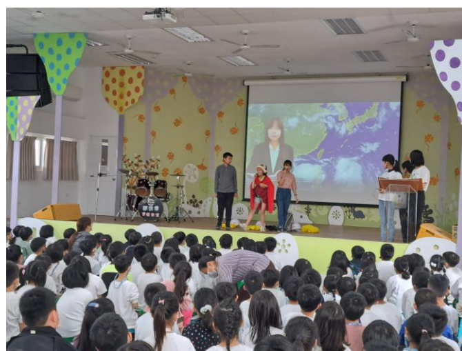
照片說明：防颱防災宣導