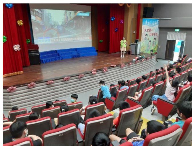
照片說明：交通事件說明。