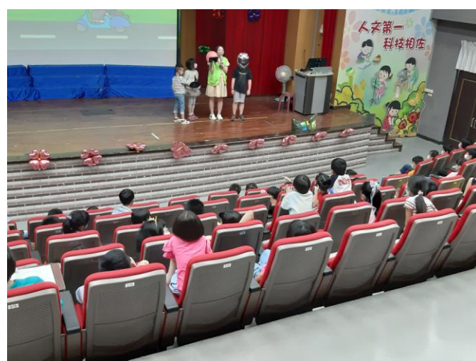
照片說明：學生認真聽講。