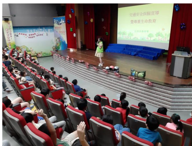
照片說明：講師介紹自己。