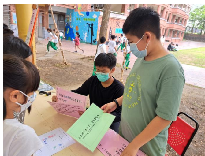
照片說明：關主測試闖關者。