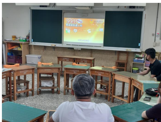
照片說明：向家長介紹 1991 報平安平台。