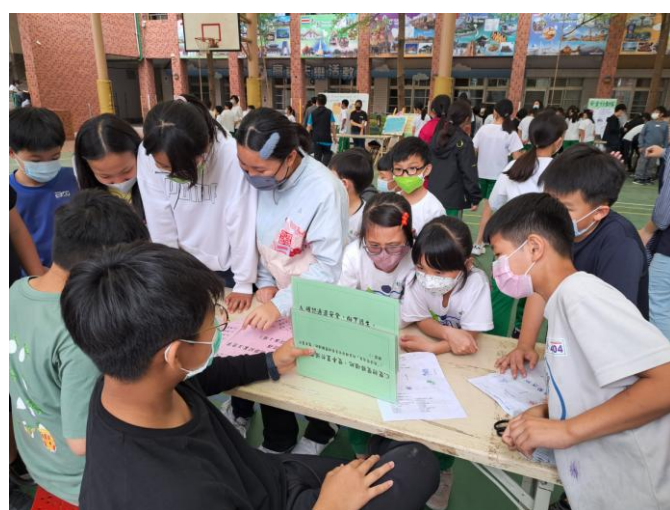
照片說明：學生認真看題闖關。