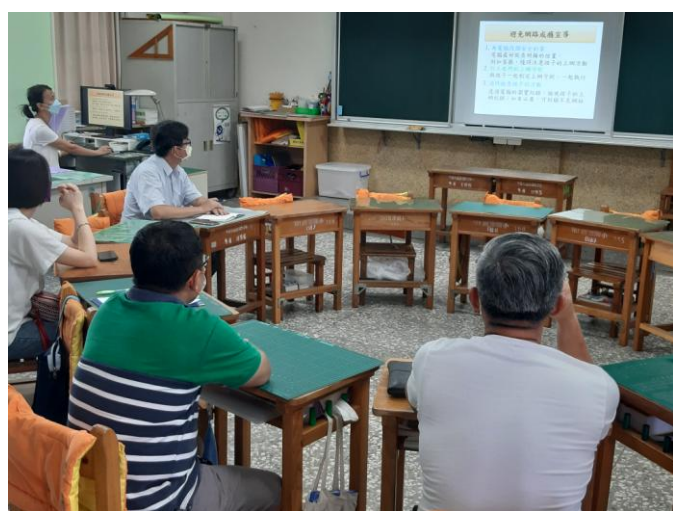
照片說明：向家長介紹 1991 報平安平台。