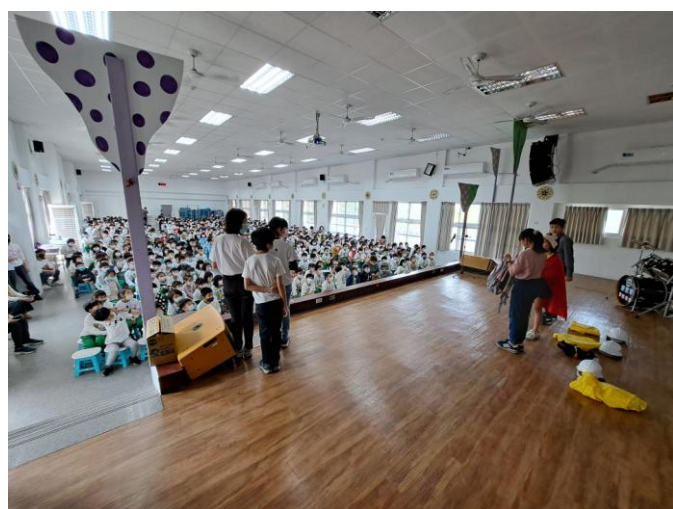
照片說明：防颱防災宣導