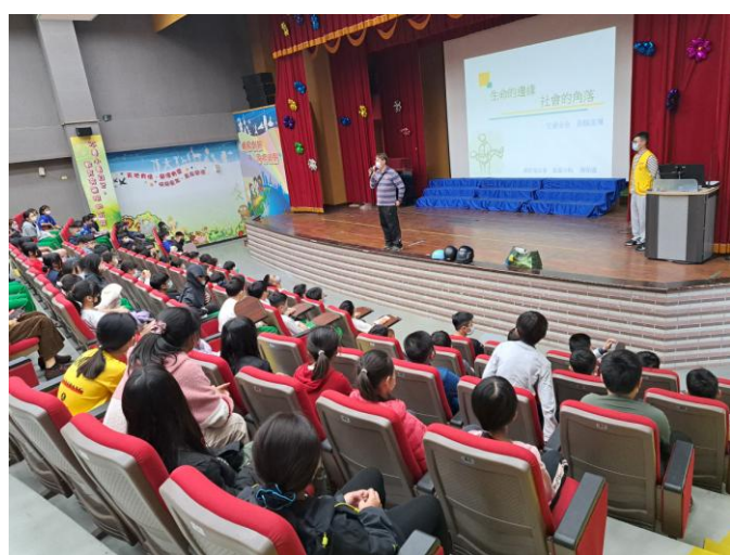
照片說明：介紹講師。