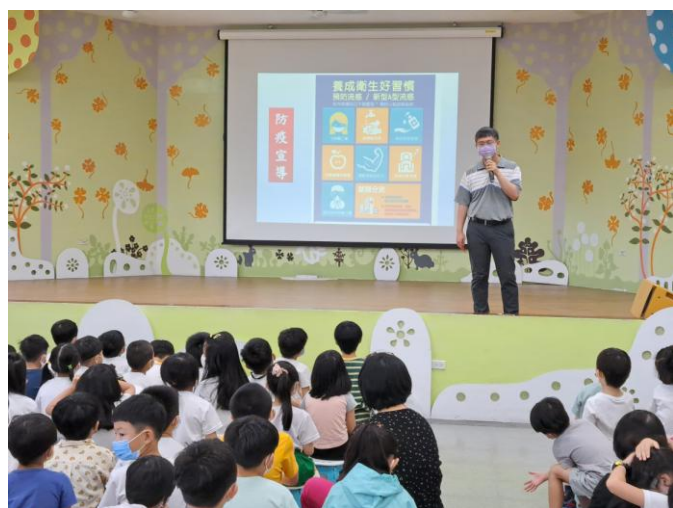
照片說明：防疫宣導，養成衛生好習慣。