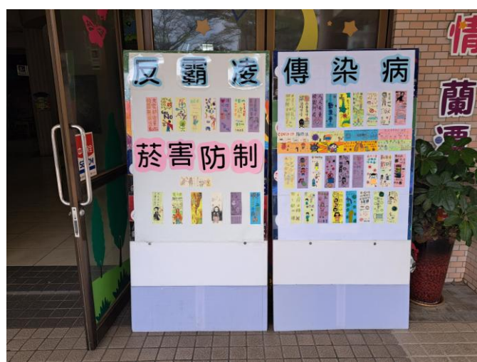
照片說明：達觀樓外展示學生防災書籤作品