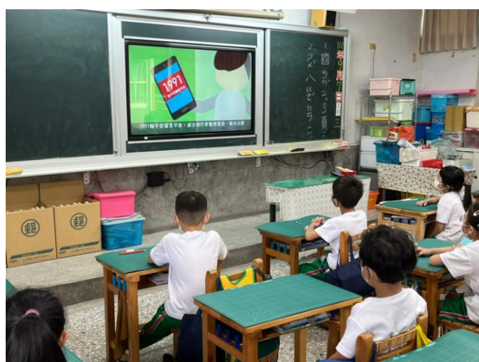
照片說明：各班於教室觀看防災影片。