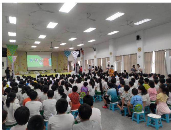
照片說明：學生認真聽講。