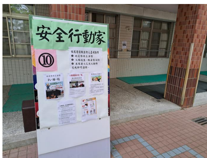
照片說明：安全行動家關卡說明