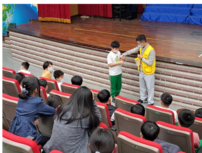
照片說明：請學生幫忙，以增加參與感。