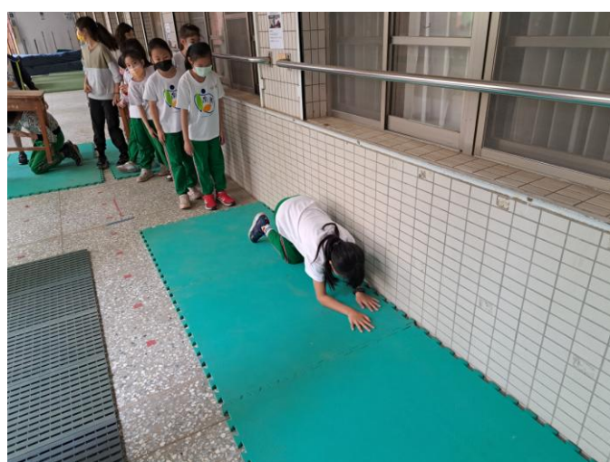
照片說明：火場逃生之低姿勢爬行練習。