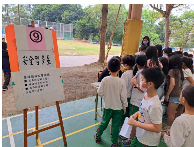
照片說明：安全智多星關卡說明。