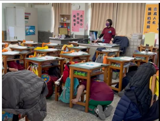
照片說明：各班模擬災害發生，進行練習。