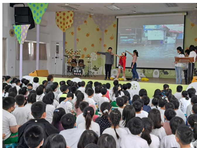
照片說明：防颱防災宣導