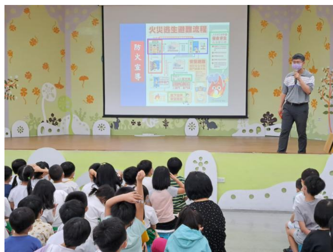
照片說明：防火宣導，介紹火災逃生避難流程。