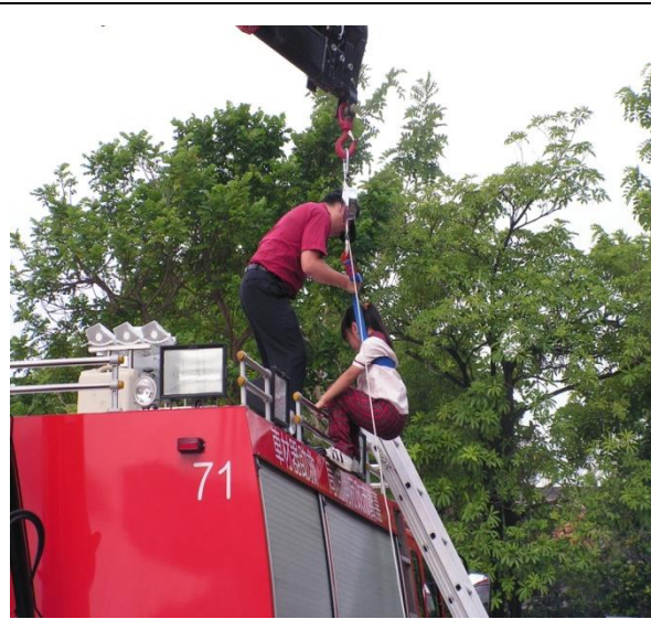
學生實際操作緩降機之體驗學習。