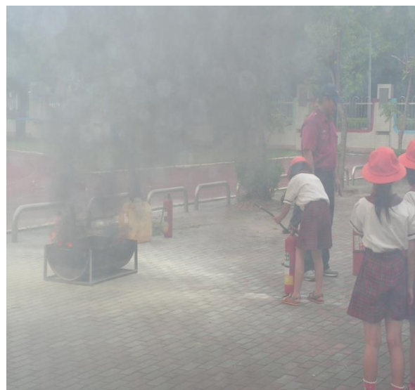
學生進行操作滅火器的教學活動。