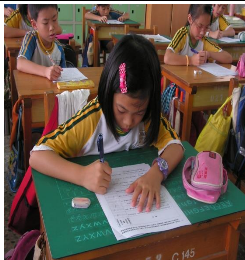
學生認真填寫教學活動學習單。