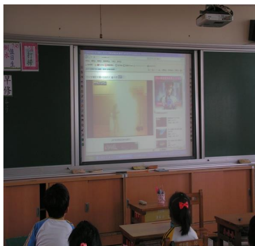
防火教學活動，觀看影片。