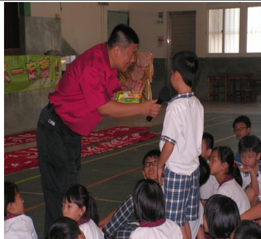
消防局隊員到校進行防火宣導。