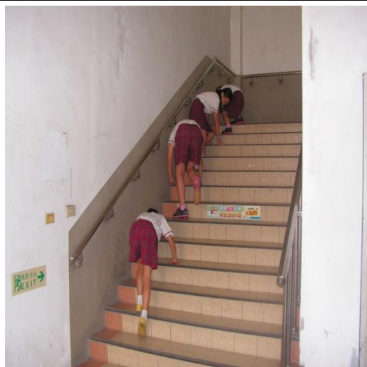
學生模擬火災現場，進行逃生動作演 鍊。