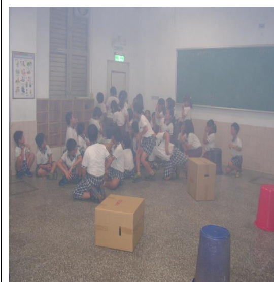
濃煙教室體驗火災發生時之應變方式。