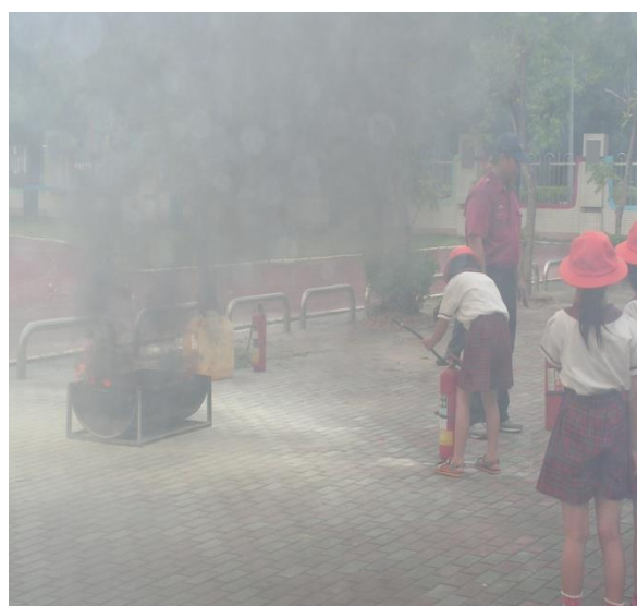
學生進行操作滅火器的教學活動。