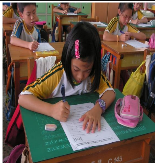
學生認真填寫教學活動學習單。