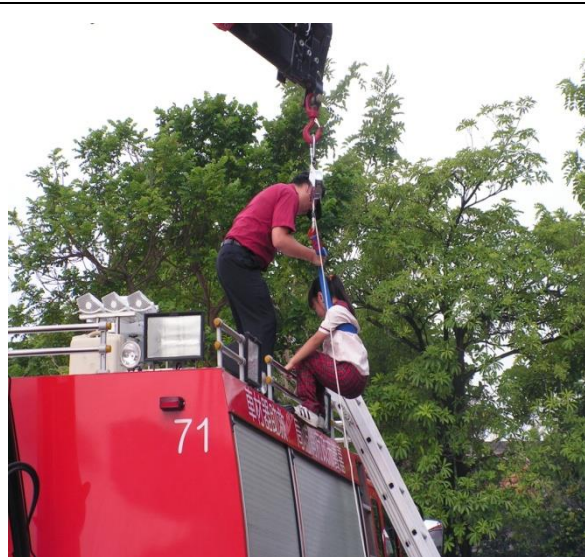
學生實際操作緩降機之體驗學習。