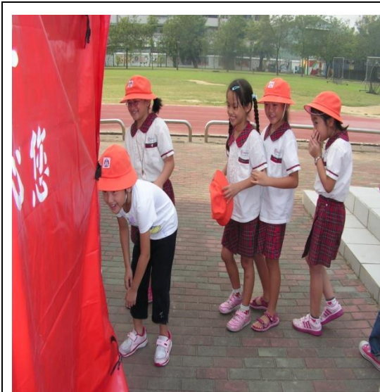
學生進行濃煙體驗學習活動。