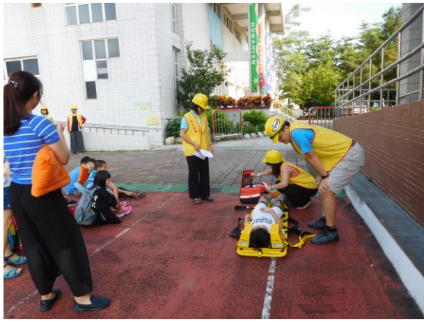
防災緊急救護宣導保安全。