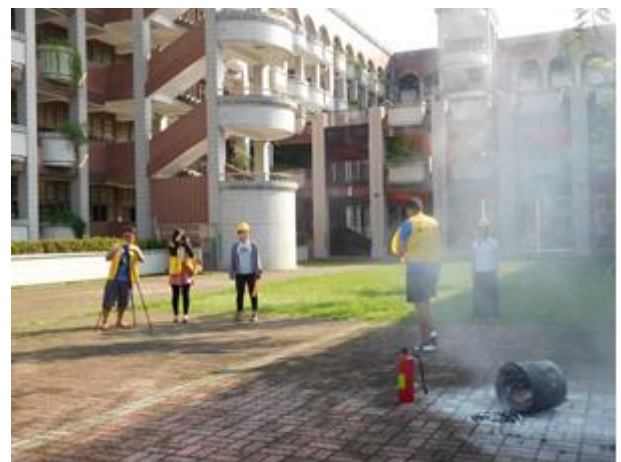
照片說明:滅火訓練。