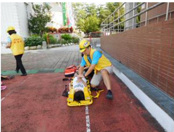
照片說明:防災緊急救護宣導保安全。