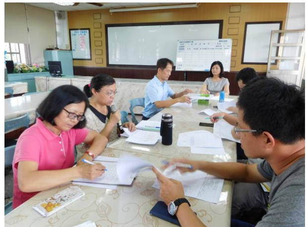
照片說明:矩陣式演練腳本