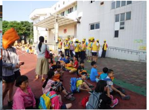
照片說明:於防災演練集合點名教學。