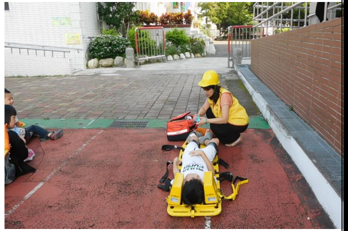
防災緊急救護宣導保安全。