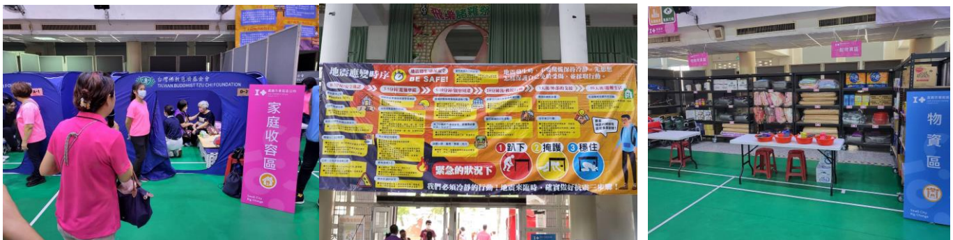
照片說明：以學校活動中心提供災民做為避難所知演練。