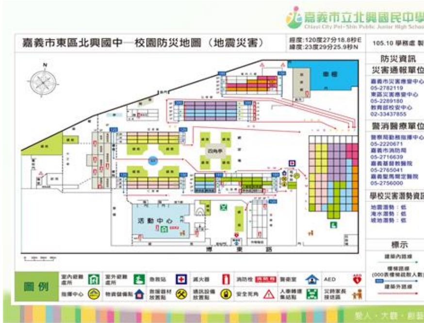
照片說明：與社地震結合避難圖