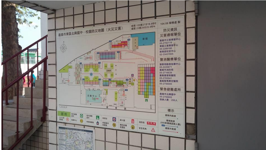
照片說明：與火災結合避難圖