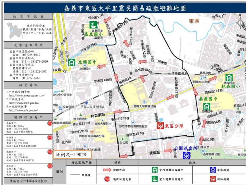
照片說明：與社區結合避難圖