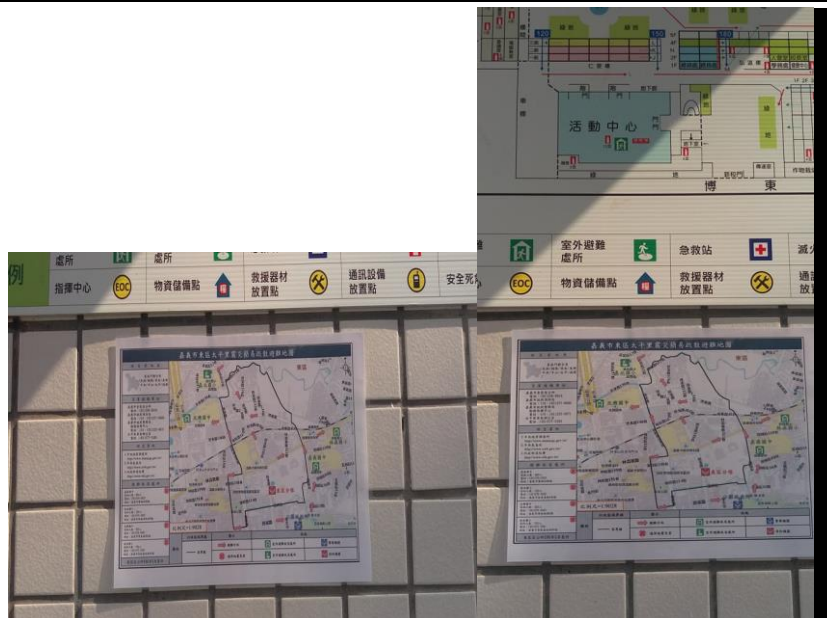
照片說明：與社區看板結合