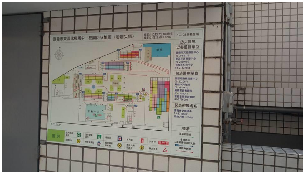
照片說明：與社地震結合避難圖