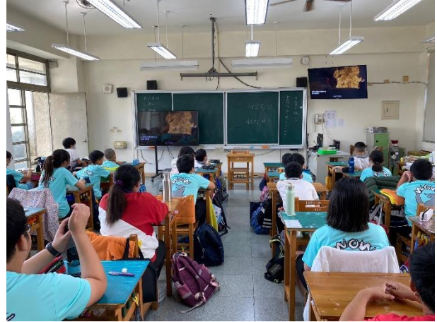
學生專心欣賞影片