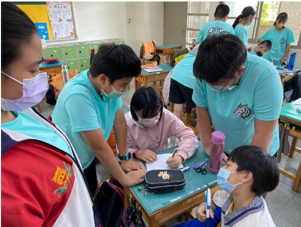
各組討論快問快答題目