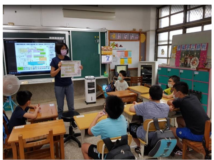
指導學生認識校園防災地圖