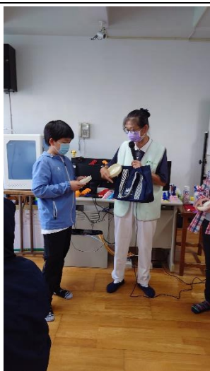
學生與慈濟師姐互動討論