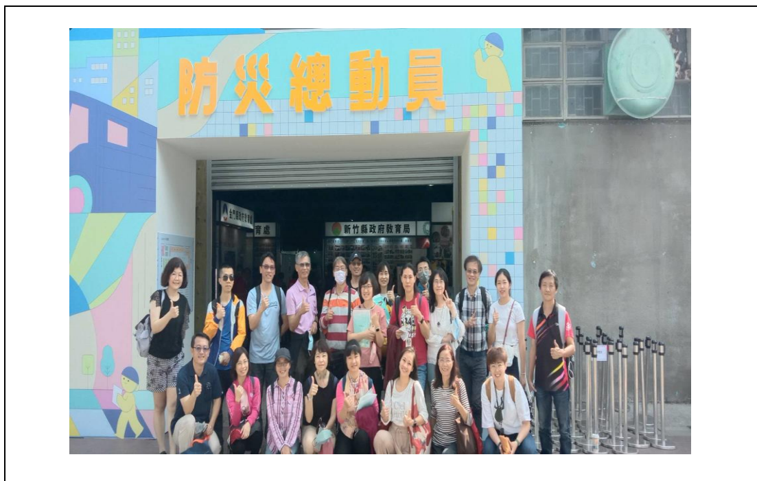
1120414 辦理防災校園大會師教師觀摩研習全體學員會後合影留念