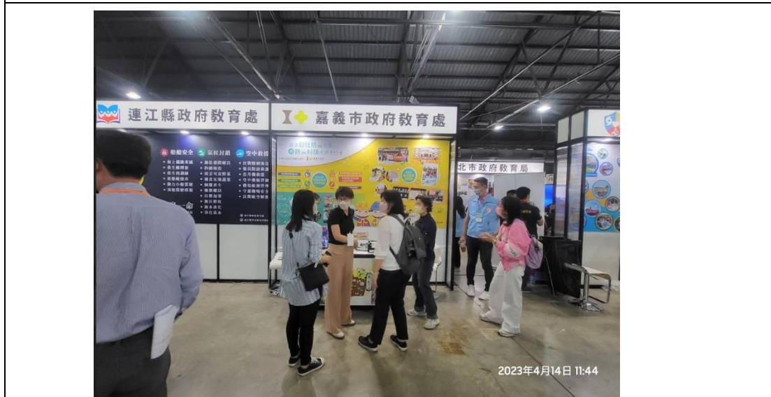
1120414 辦理防災校園大會師教師觀摩研習活動情形