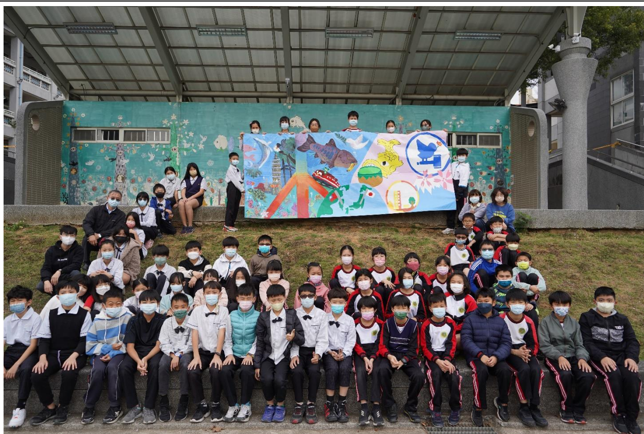
照片說明：壁畫交流完成發表－永續經營永續城鄉珍愛地球