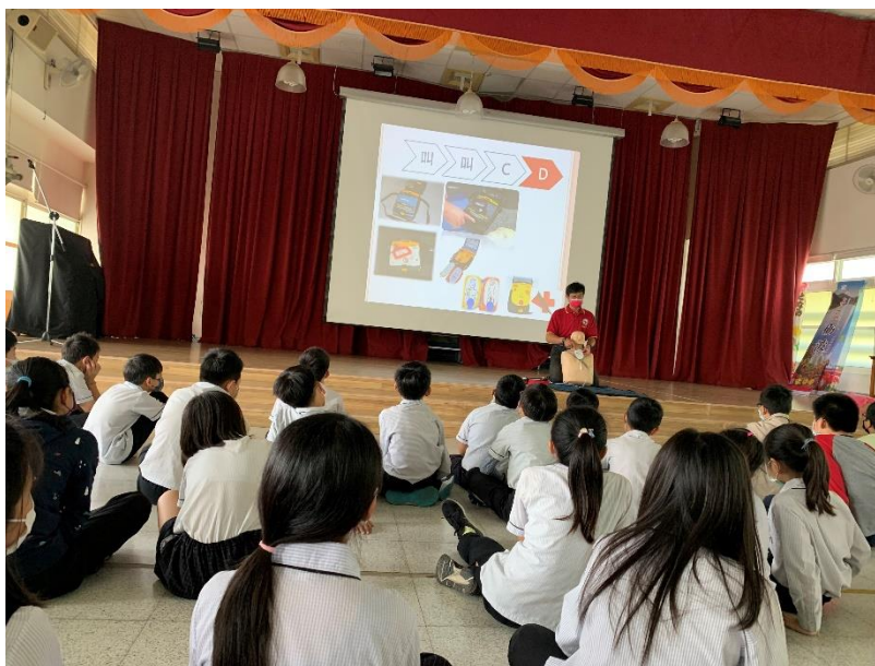
照片說明：五年級 CPR 訓練落實防災自救知能