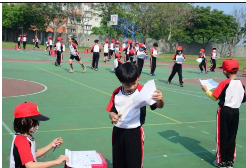
照片說明：校園定向系列活動融入防災定向闖關活動—學生進行防災定向活動