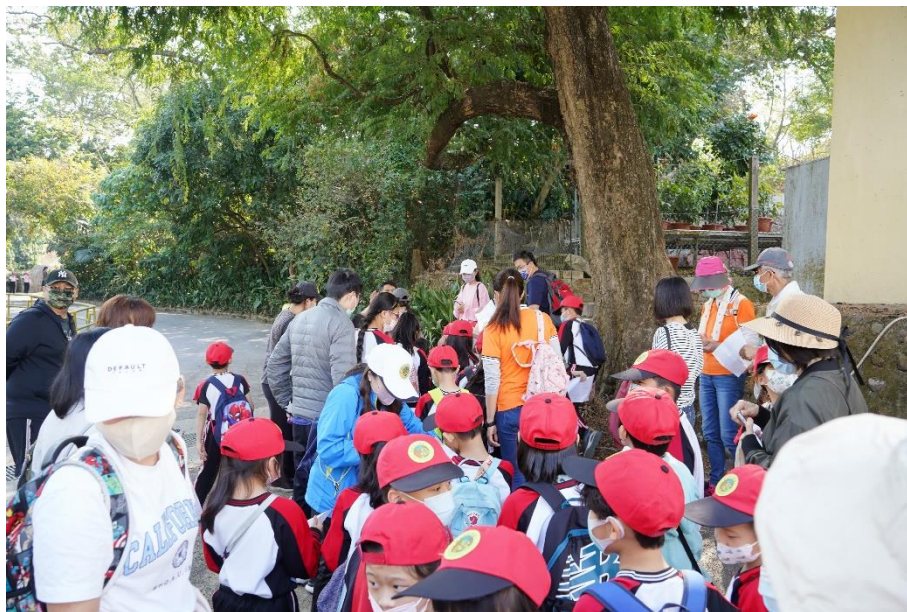
照片說明：校慶健行定向活動－水土保持定向融入防災教育