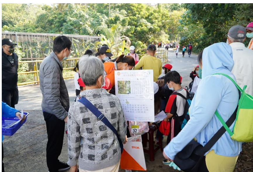
照片說明：校慶健行定向活動－水土保持定向融入防災教育