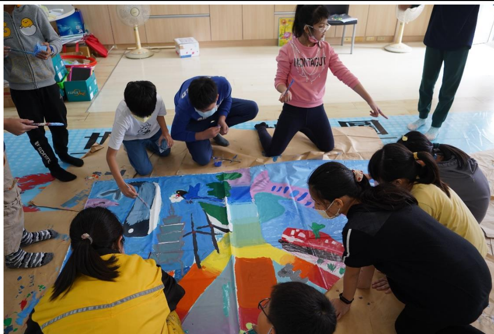
照片說明：壁畫交流融入氣候變遷減災觀念-壁畫設計上色