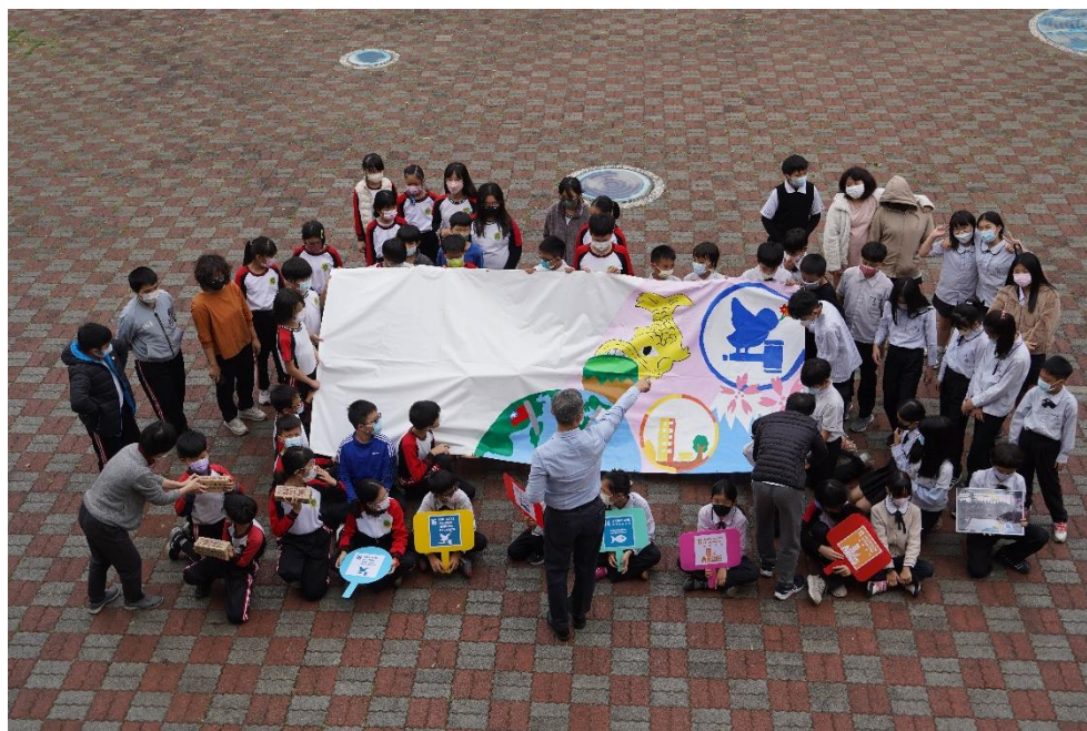
照片說明：日本壁畫交流-東浦町立緒川小学校-SDGs 11 14 16-日本交流壁畫開箱