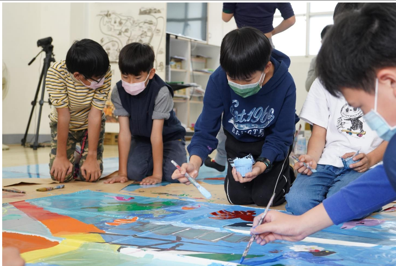
照片說明：壁畫交流融入氣候變遷減災觀念－壁畫設計上色