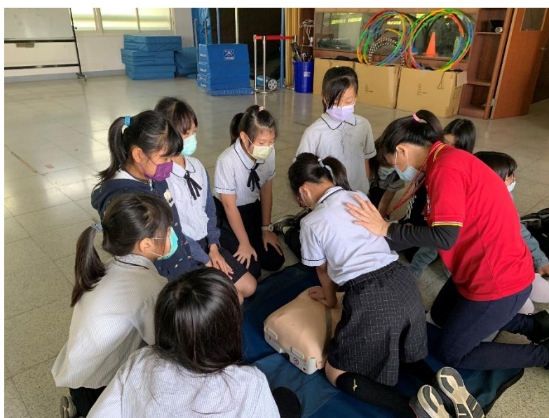
照片說明：五年級 CPR 訓練落實防災自救知能