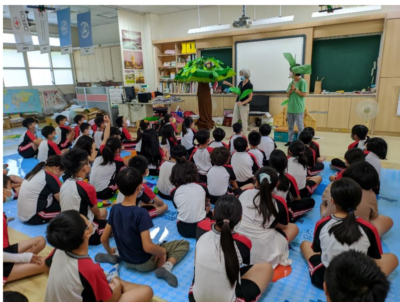
照片說明：認識土石流危害