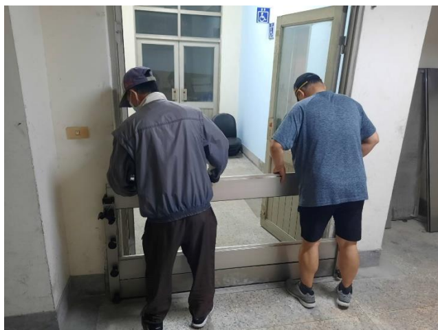
汛期前進行例行性安檢與整理