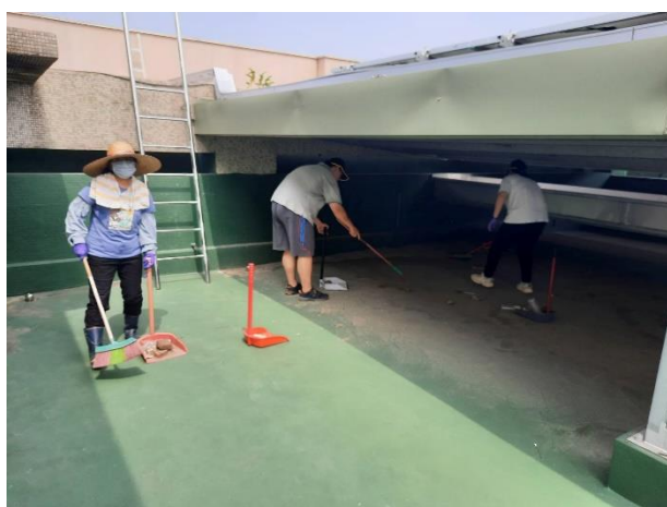
定期檢查大樓頂層結構安全