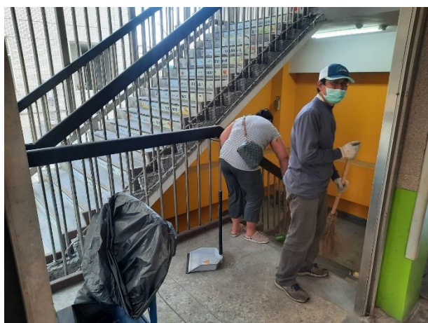
逃生路線安檢與維護