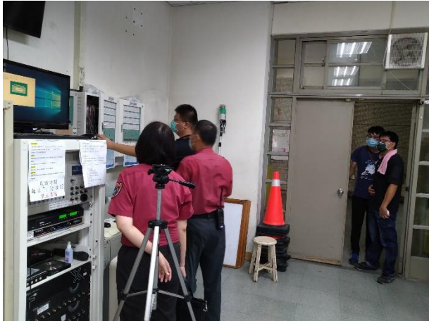
定期檢查消防設施與廣播系統