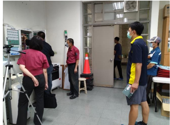
相關人員進行消防安全檢查