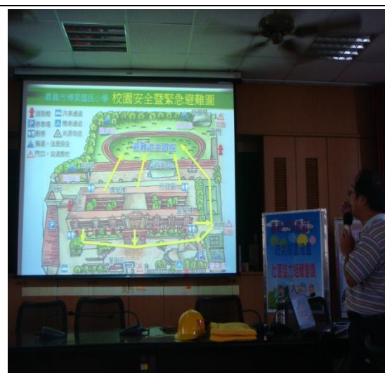
本校相關災害潛勢之說明及應變作為。