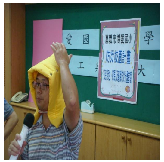
說明防災頭套的使用方式及重要性。