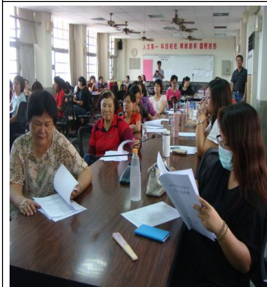
大家針對防災內容仔細聆聽。