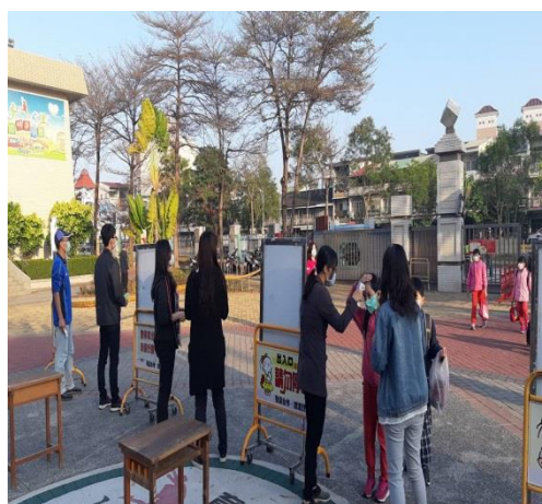
學生進入校園必須量體溫和貼貼紙。