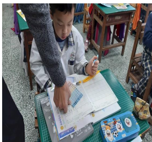
檢查學生健康護照管理。