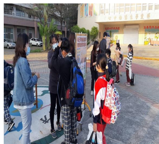
每天早上上學時間進行防疫。