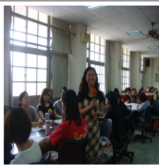
社區志工踴躍發表意見及提出建議。