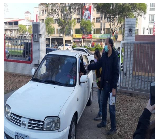
車輛進出必須量體溫。