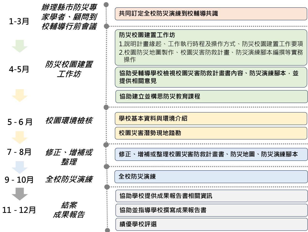
圖 2、年度輔導作業流程表