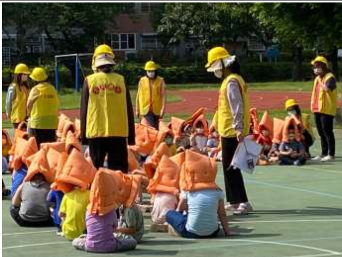
避難演練時各班導師將班級防災包攜至集合地點即有全班相關聯絡資訊