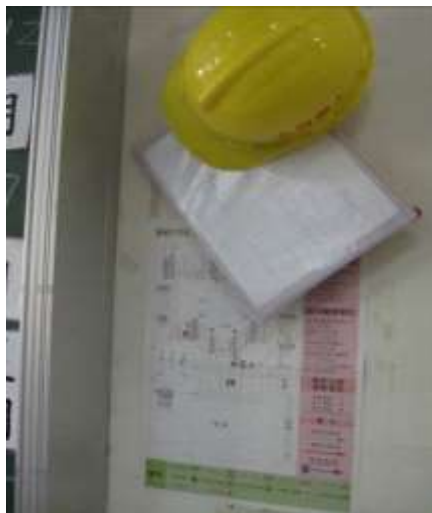
班級防災包懸掛於各教室接近避難路線出口處