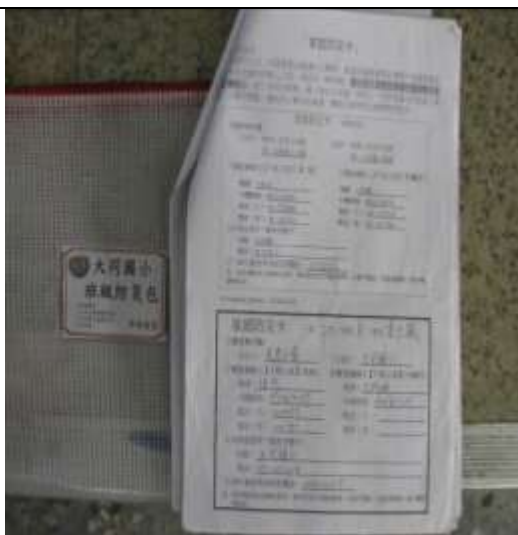
家庭防災卡置於每班的班級防災包中