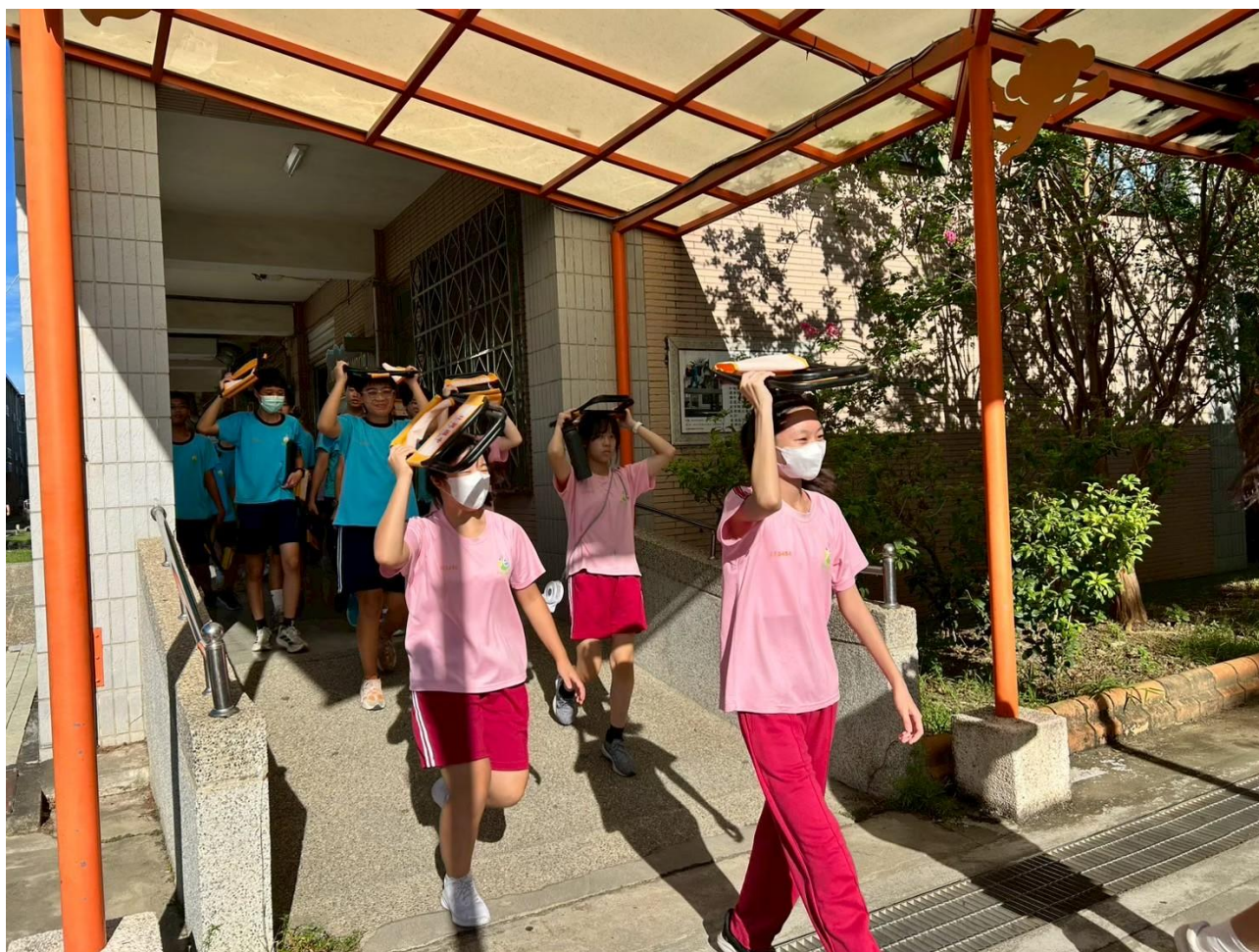
照片說明：進行學生疏散到操場集合。