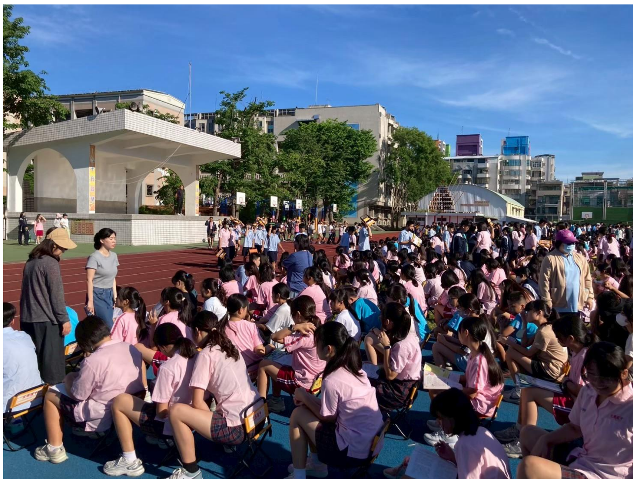
照片說明：進行學生疏散到操場集合。