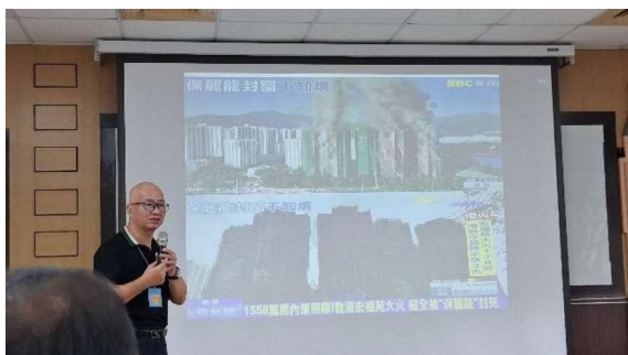
講師進行案例講解與說明