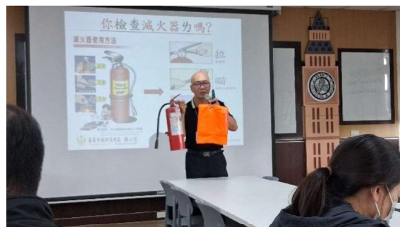
講師進行滅火工具講解與說明