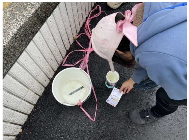
水寶小隊出任務－檢測北排水質