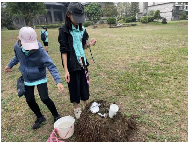
水寶小隊出任務－檢測北排水質

成果概述：本校成立水環境巡守隊－林森國小水寶小隊，為嘉義市唯一一支以學生為主要組成成員之水環境巡守隊伍。