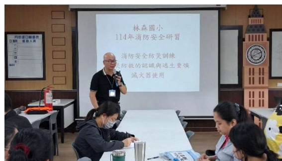
講師進行講解與說明