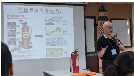
講師進行滅火工具講解與說明