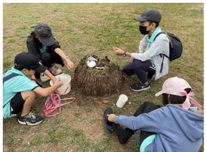
水寶小隊出任務－記錄樣本資訊