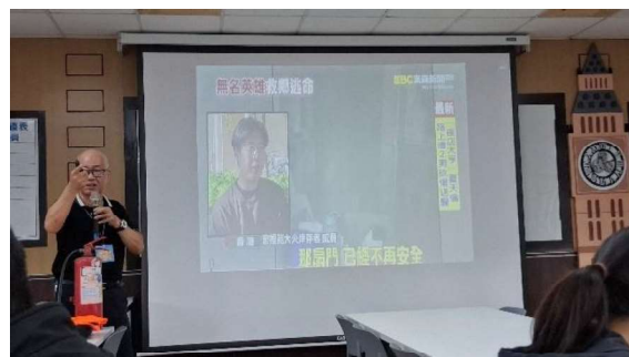
講師進行案例講解與說明