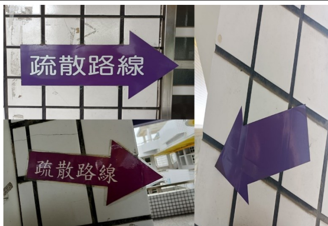
疏散路線標示清楚