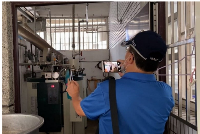
檢查鍋爐管線開關