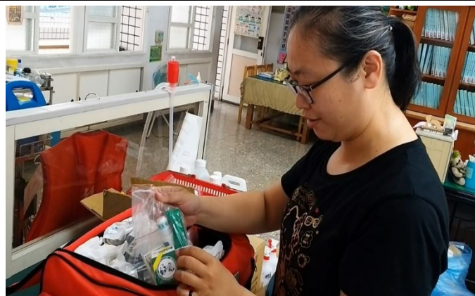
緊急救護包整備齊全