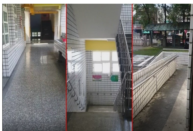
疏散路線無障礙物