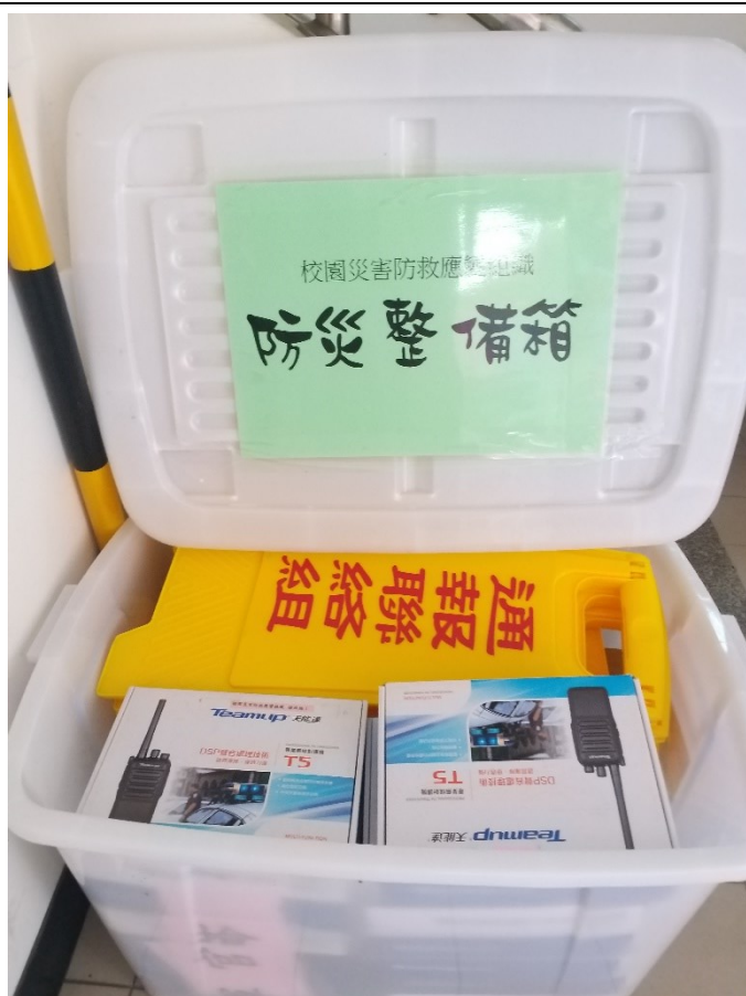
防災整備箱內器材