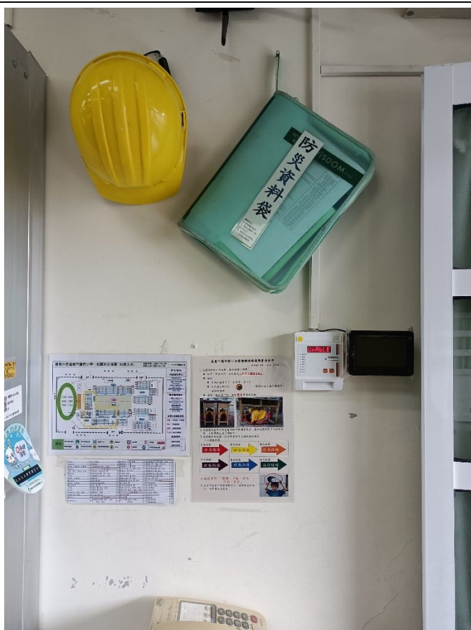
教室內防災器材完備