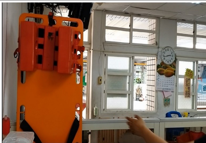
脊椎受傷用之長背板