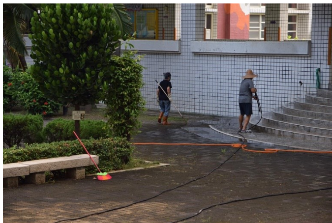
疏散路線定期清洗