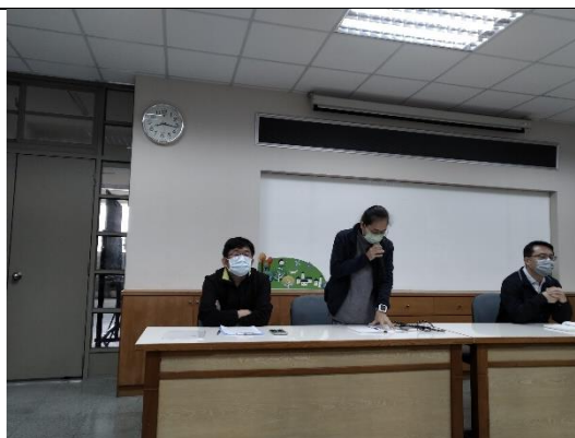
會議討論注意事項