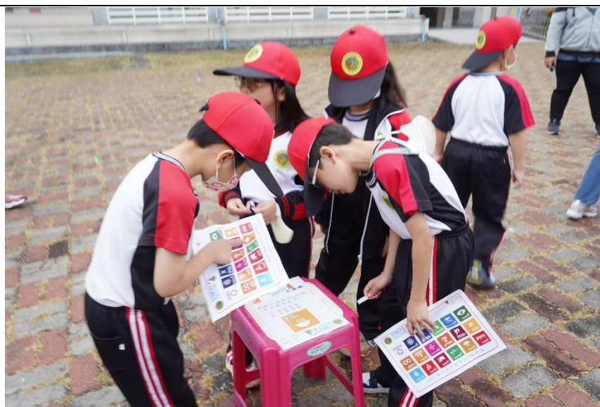
照片說明：校園定向系列活動融入防災定向闖關活動－學生進行防災定項活動