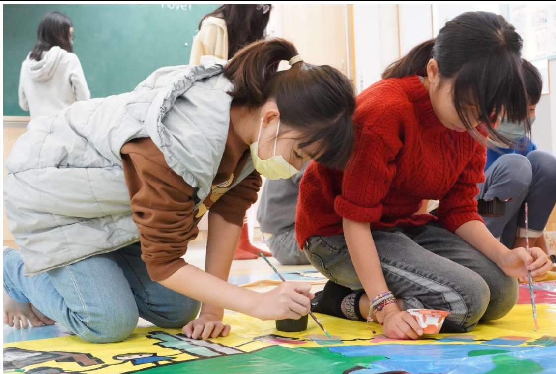
照片說明：壁畫交流融入氣候變遷減災觀念－壁畫設計上色