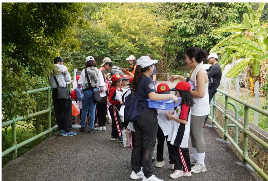
照片說明：校慶健行定向活動－水土保持定向融入防災教育