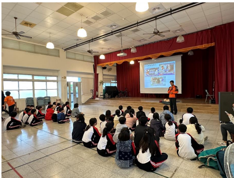
照片說明：高年級 CPR 訓練落實防災自救知能