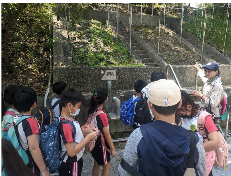
照片說明：認識土石流危害