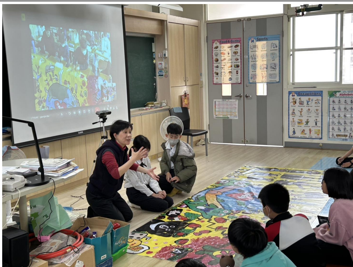
照片說明：壁畫交流完成發表－永續經營永續城鄉珍愛地球