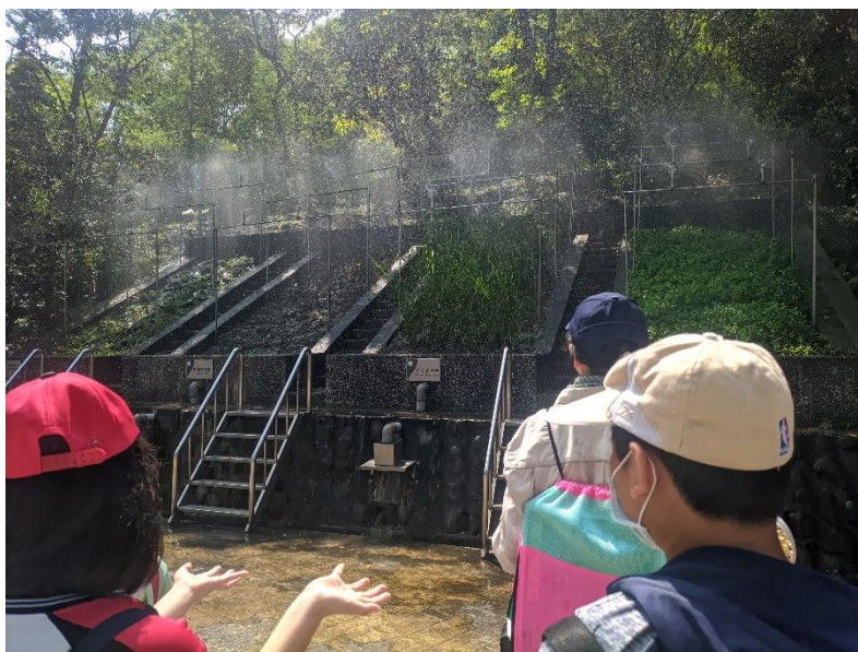
照片說明：認識水土保持方法避免土石流危害