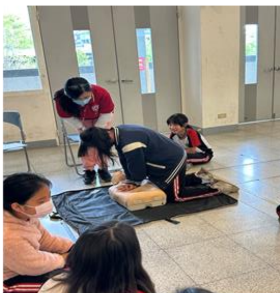
照片說明：高年級 CPR 訓練落實防災自救知能