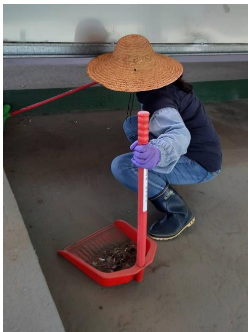
角落環境安檢與整潔