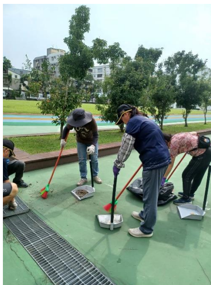
汛期前進行例行性安檢與整理