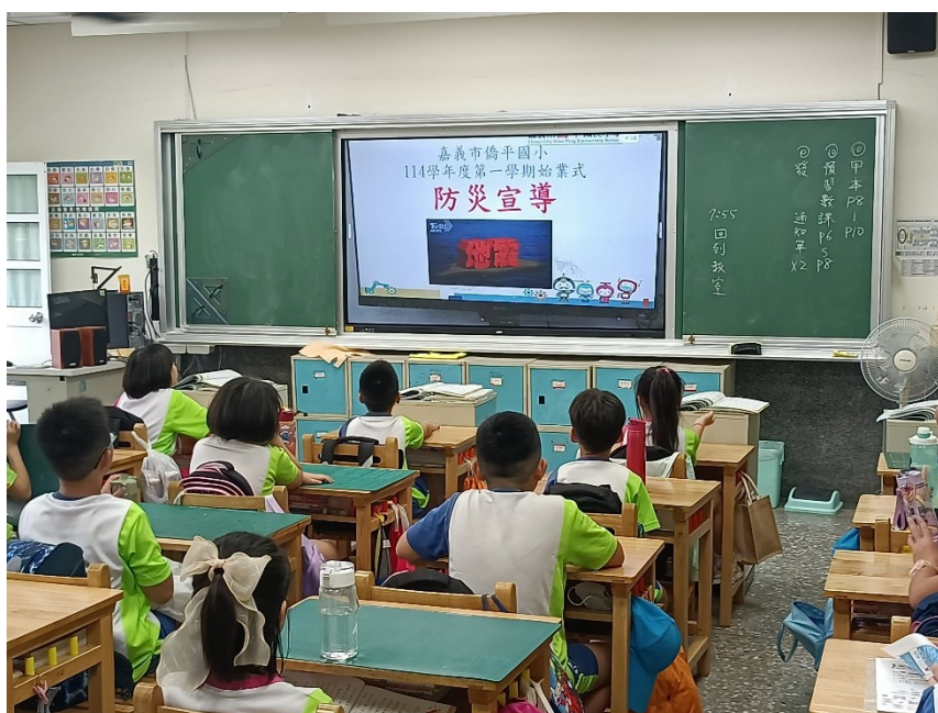
照片說明：114 年度第一學期始業式防災宣導-地震災害的恐怖