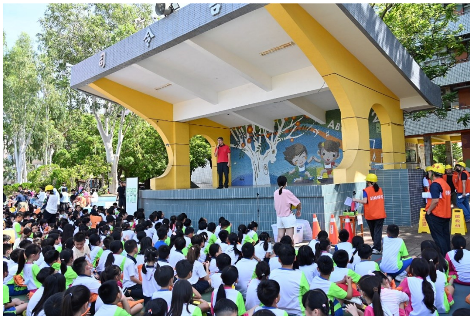
德安消防分隊蒞校進行防災防震教育宣導-地震避難須知