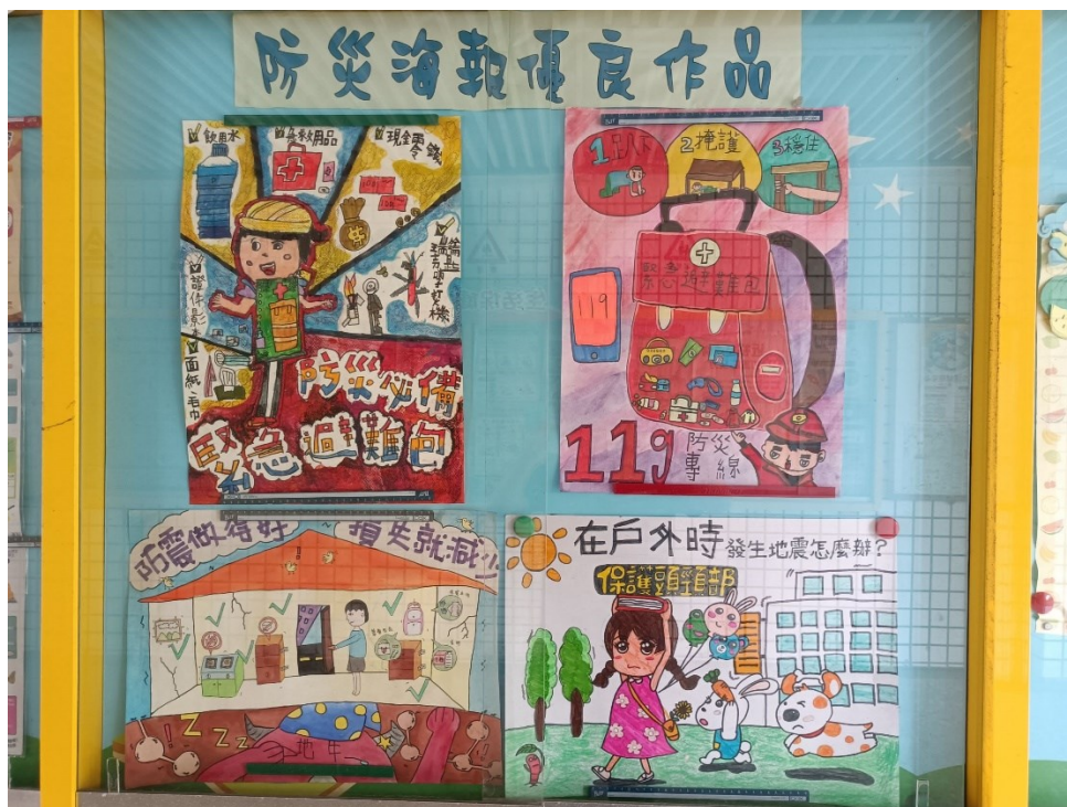
防災海報優良作品欣賞