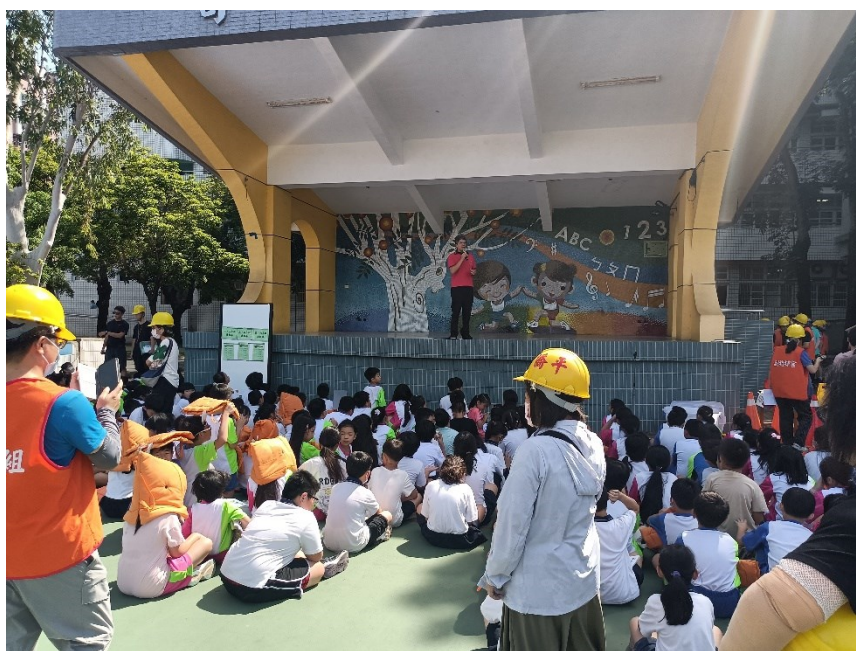
德安消防分隊蒞校進行防災防震教育宣導-請學生示範趴下、掩護、穩住