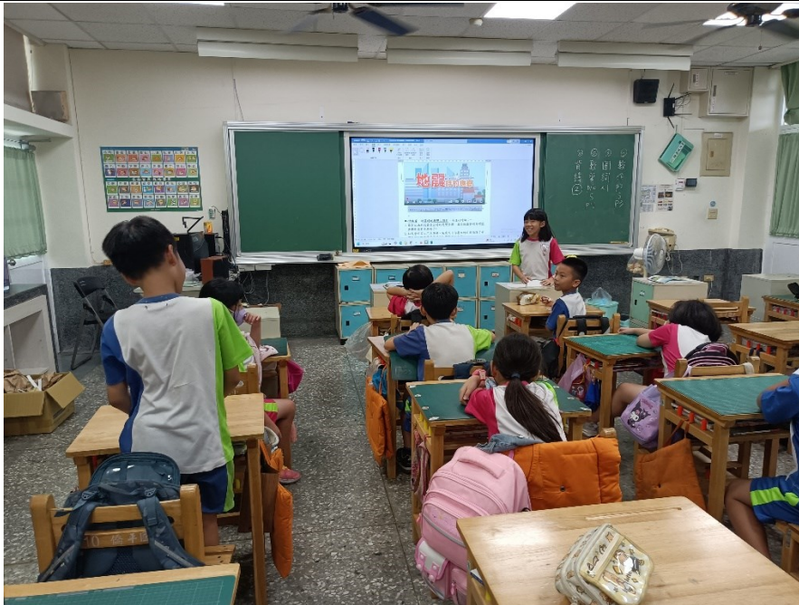
先觀看「防震演練宣導」影片後，再進行班會議題討論