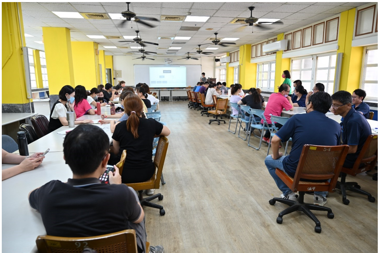
火災分析與消防觀念建構與操作宣導