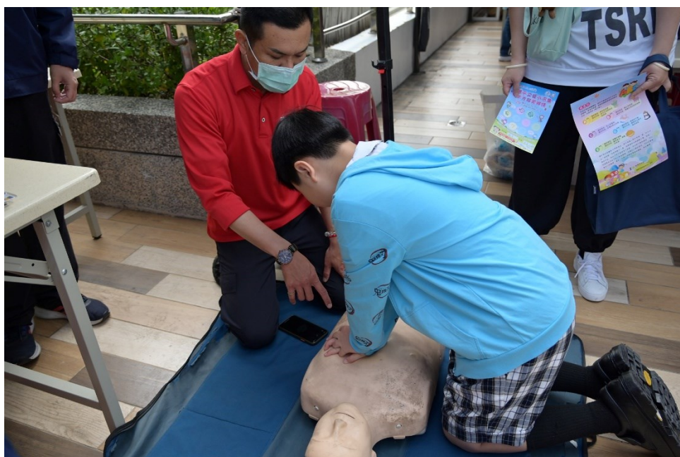
德安消防分隊響應文藝芳鄰活動-設 CPR 教學闖關活動