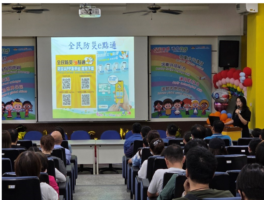
114 年度第一學期班級親師座談會-鼓勵並宣導下載全民防災 e 點通