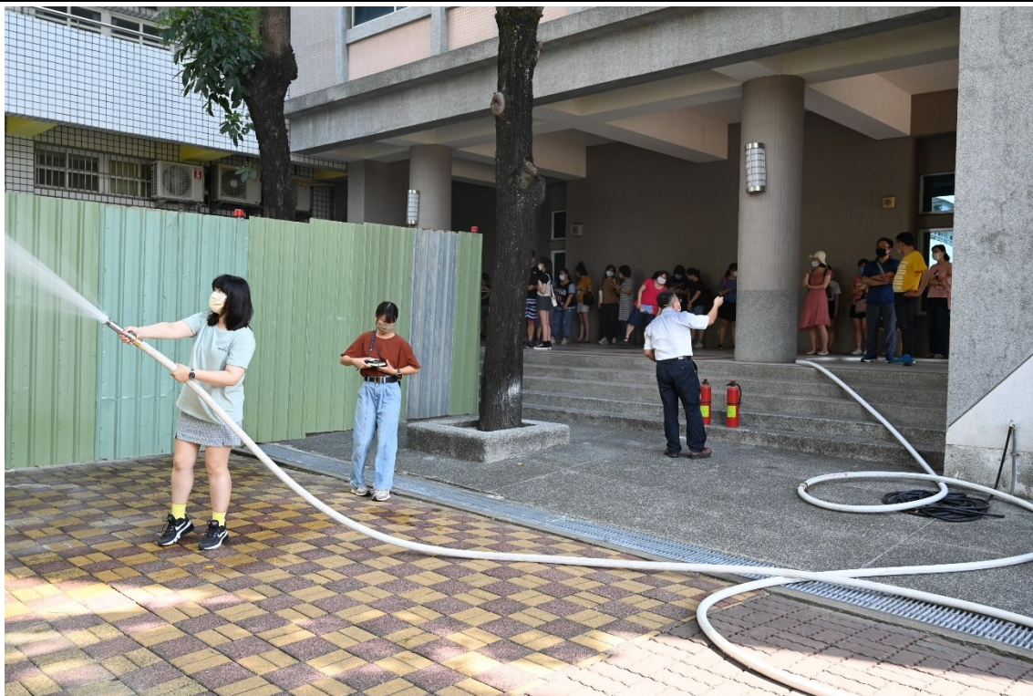
消防設備操作與學習