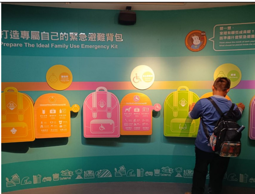
學生學習如何打造緊急避難背包