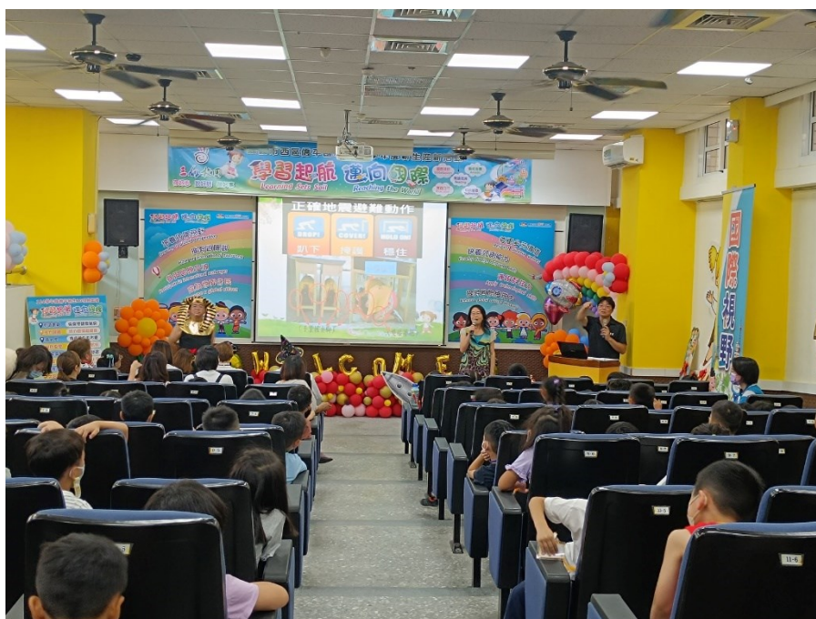
照片說明：藉由新生家長座談會與家長傳達正確避難防災的動作。