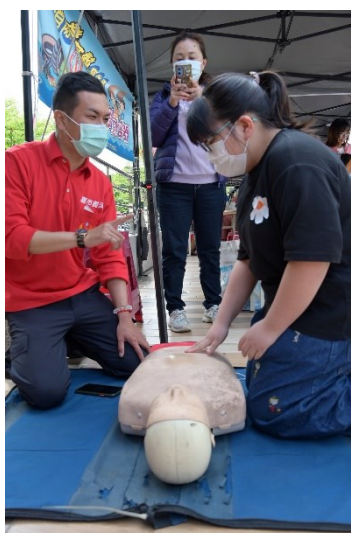
家長與學生在消防隊員的鼓勵下踴躍嘗試心肺復甦術