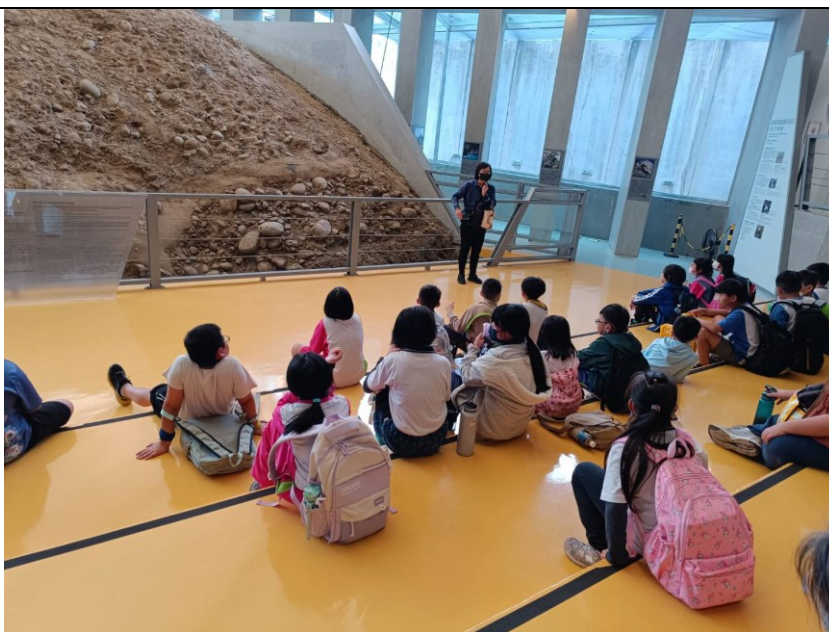
導覽員與學生說明地震所造成造成土石鬆動等相關現象