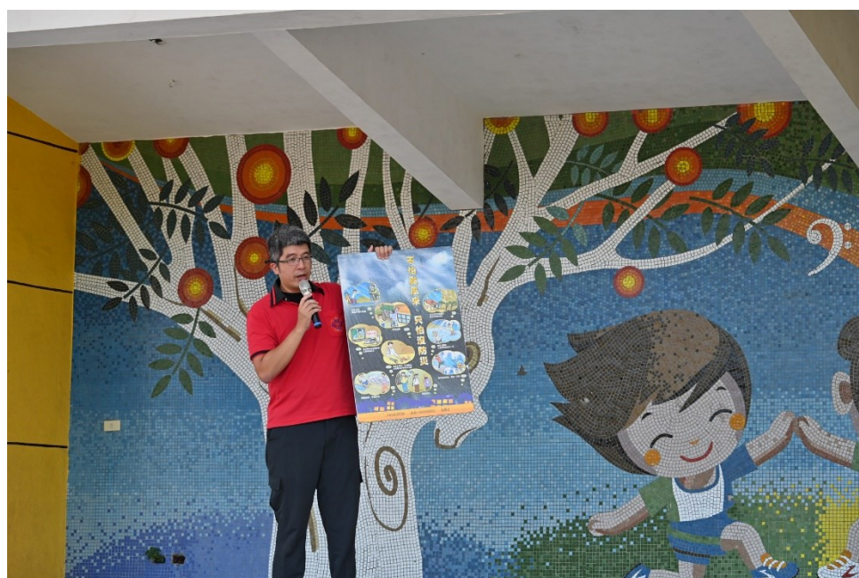
德安消防分隊蒞校進行防災防震教育宣導-有獎徵答