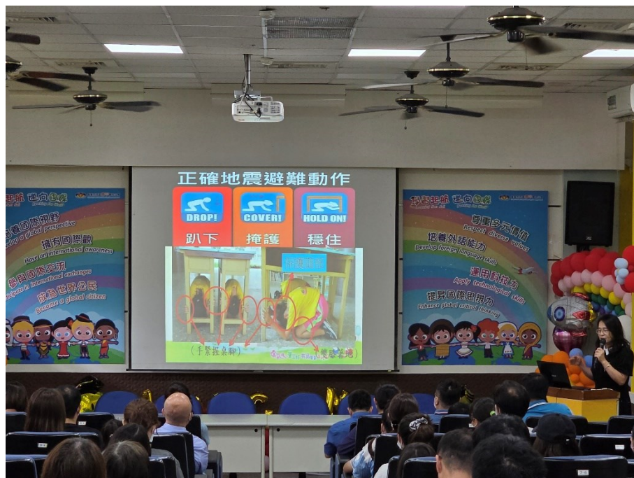
114 年度第一學期班級親師座談會-宣導防震避難三步驟