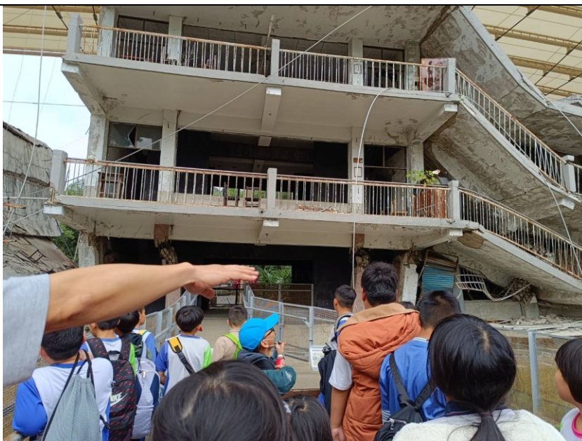
導覽員帶領學生查看當年 921 大地震所遺留下來的倒塌校舍