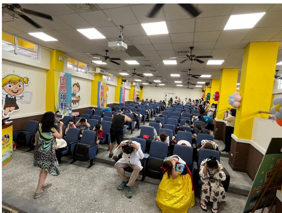
照片說明：學務主任邀請新生家長練習會議室防震動作-趴下、掩護、穩住。