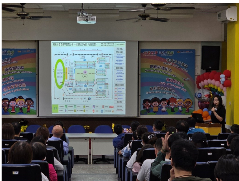
114 年度第一學期班級親師座談會-校內防災路線與地圖說明