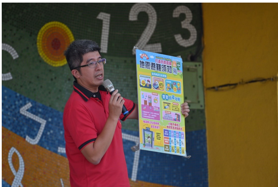
德安消防分隊蒞校進行防災防震教育宣導-在不同場合進行地震避難