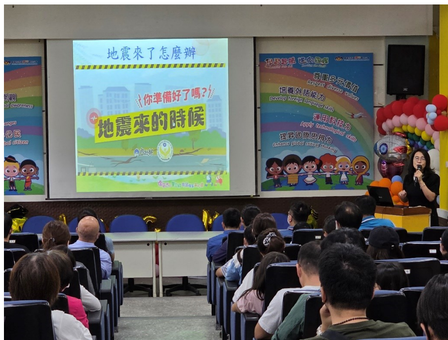
114 年度第一學期班級親師座談會-宣導地震來時的應變措施