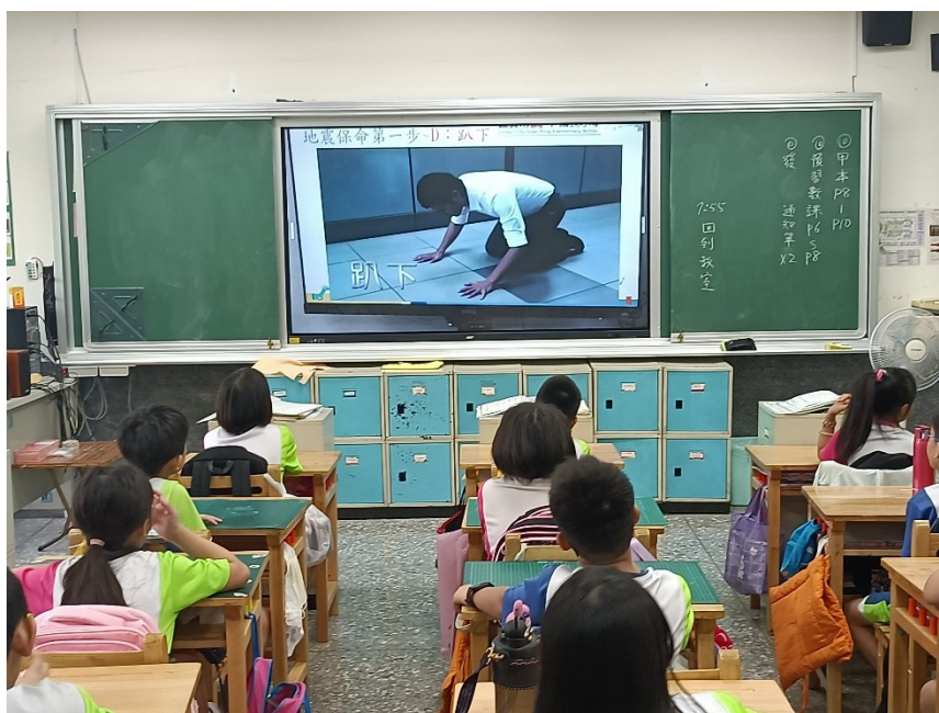
照片說明：114 年度第一學期始業式防災宣導地震保命三步驟:趴下、掩護、穩住