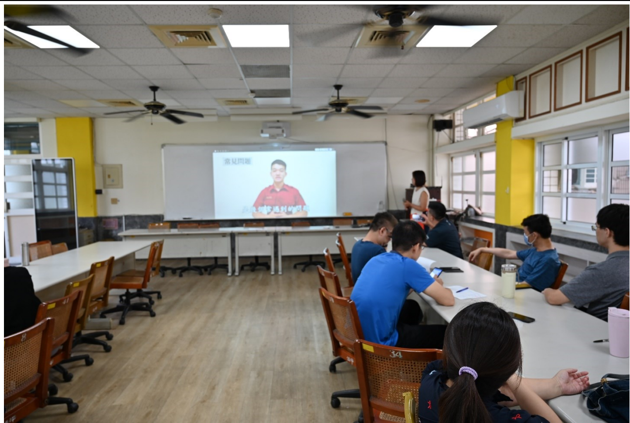
用火安全防護逃生演練與救護包紮