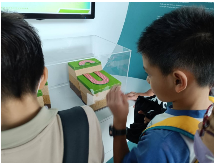
學生觀看地震所造成的斷層錯動結構圖