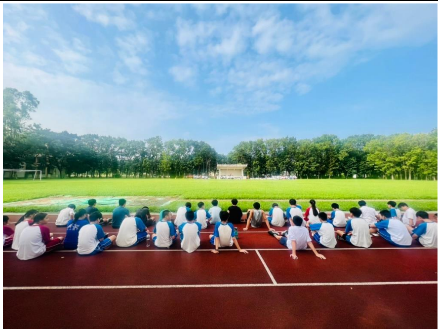
照片說明：室外學生就地掩護