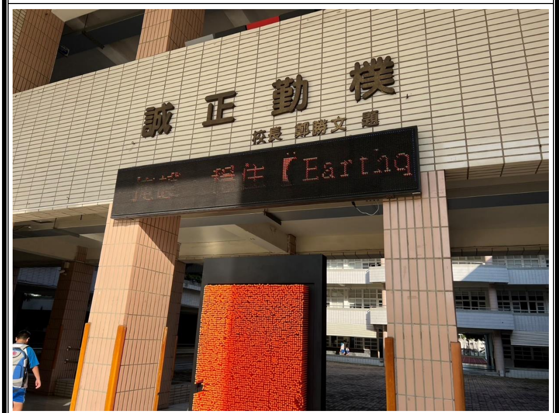
照片說明：跑馬燈宣導「趴下、掩護、穩住」保命原則