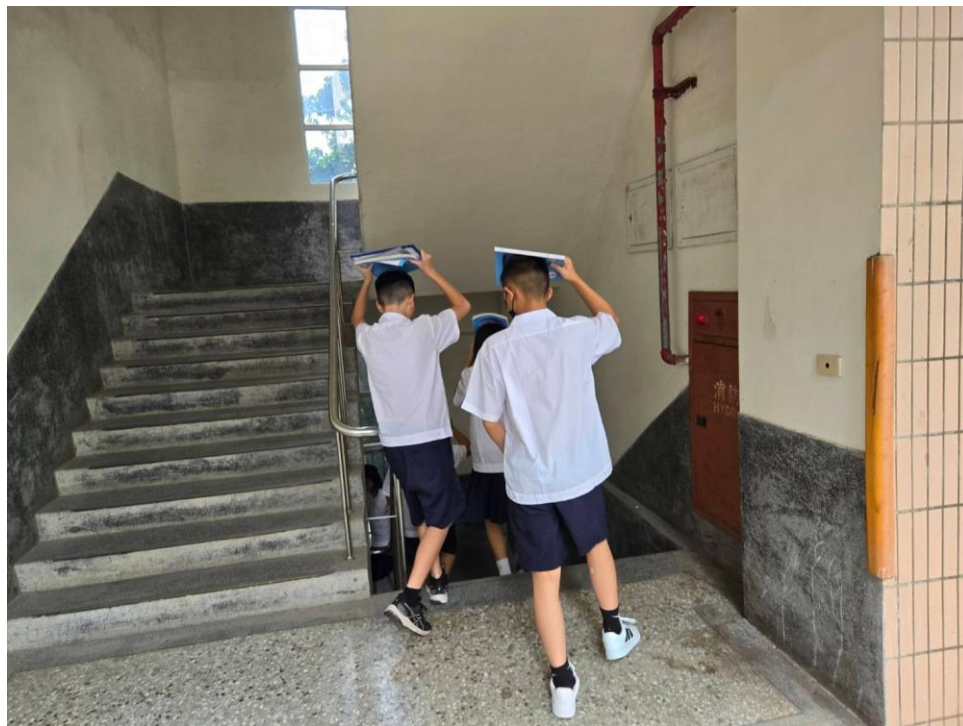
照片說明：行經樓梯，確實做好「不推、不語、不跑」原則