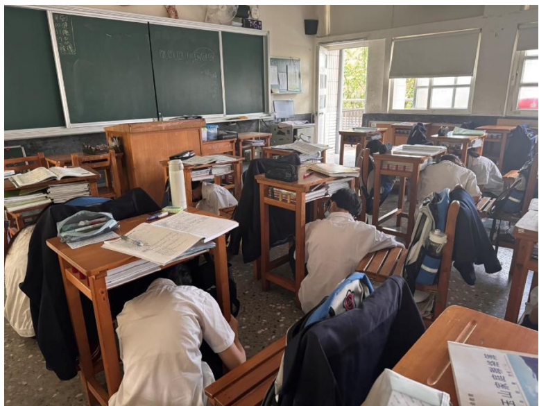
照片說明：學生在教室就地進行掩護