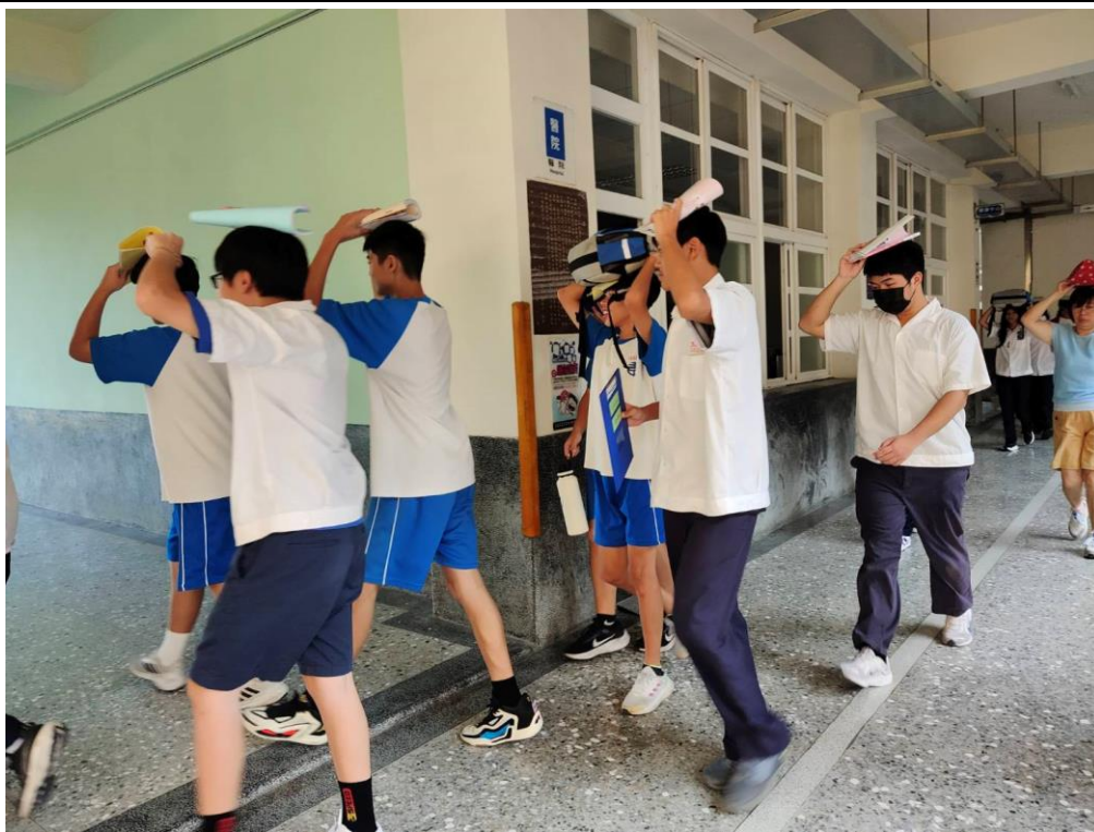
照片說明：行經建築物，確實保護頭部