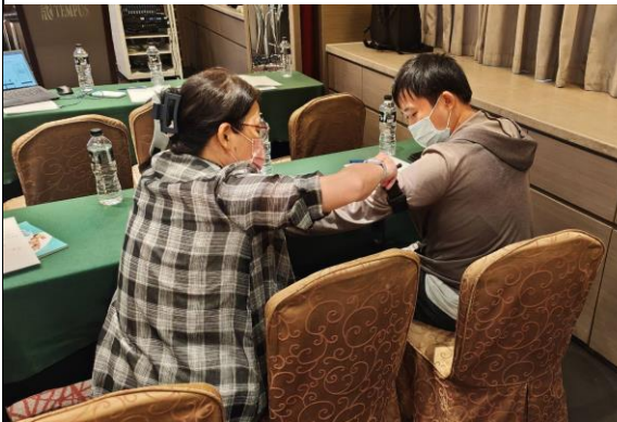
圖 15 創傷止血課程