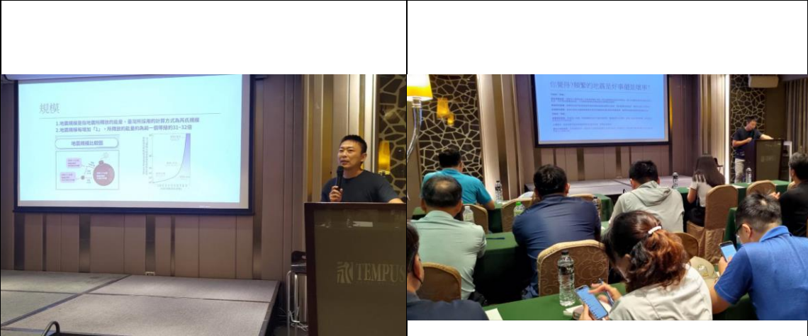
圖 1 災害原則及防災迷思概念破除