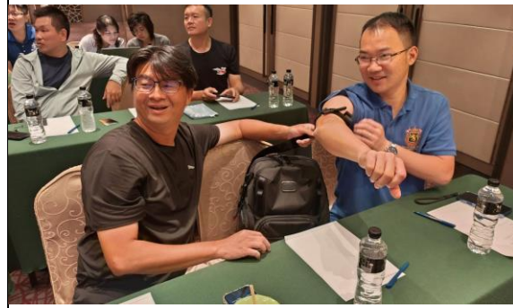
圖 14 創傷止血課程