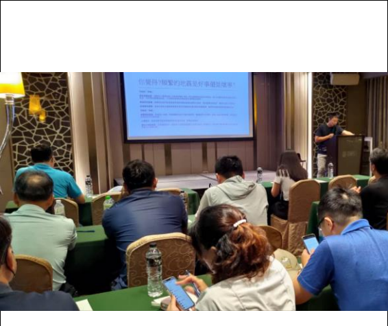
圖 2 災害原則及防災迷思概念破除