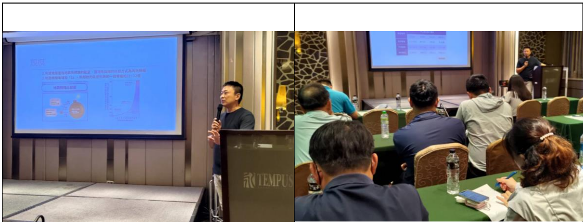
圖 7 事故現場處置原則