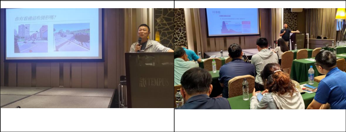
圖 5 事故現場處置原則