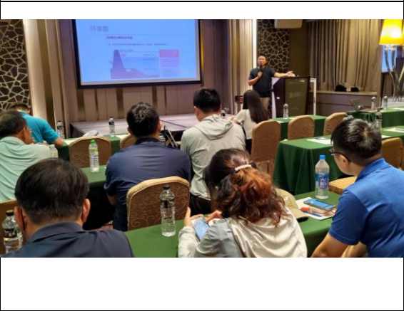
圖 6 事故現場處置原則