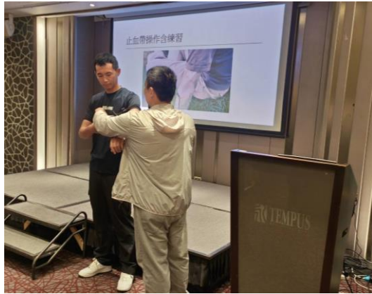
圖 13 創傷止血課程