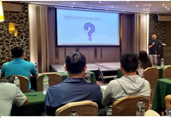
圖 4 災害原則及防災迷思概念破除