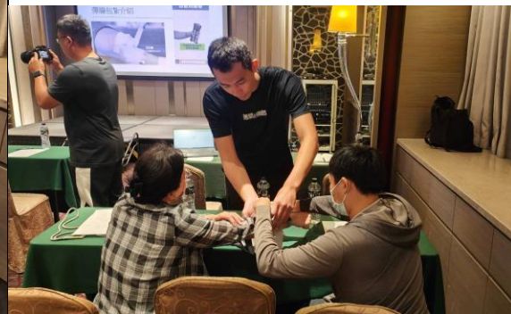
圖 16 創傷止血課程