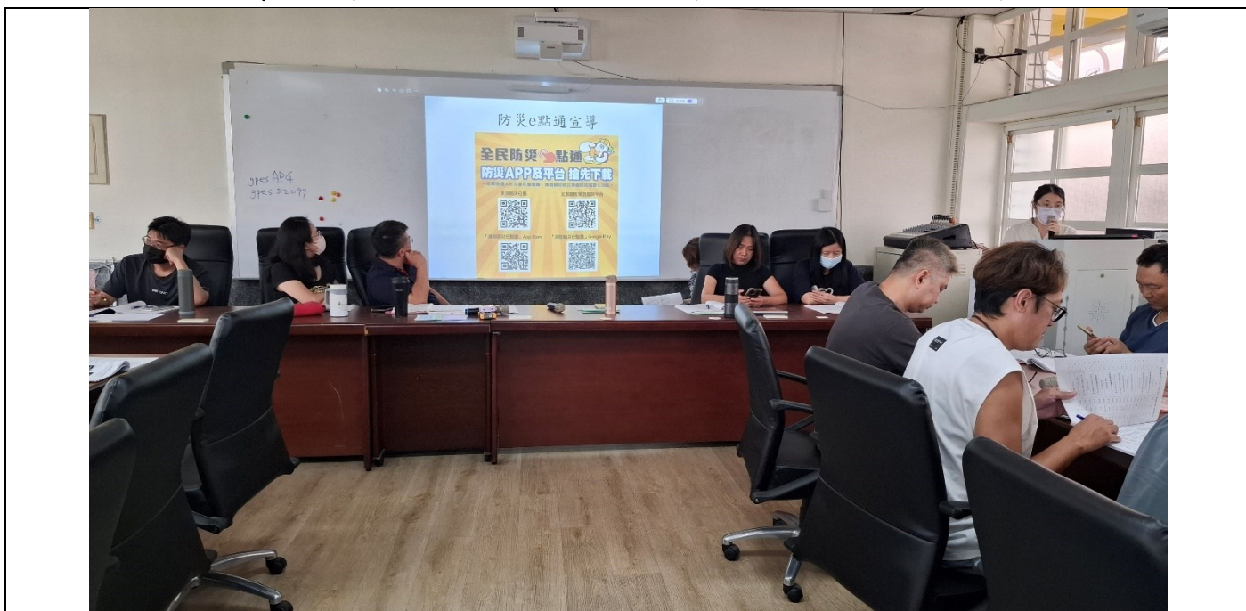
全校會議與同仁宣導並下載防災e點通 app