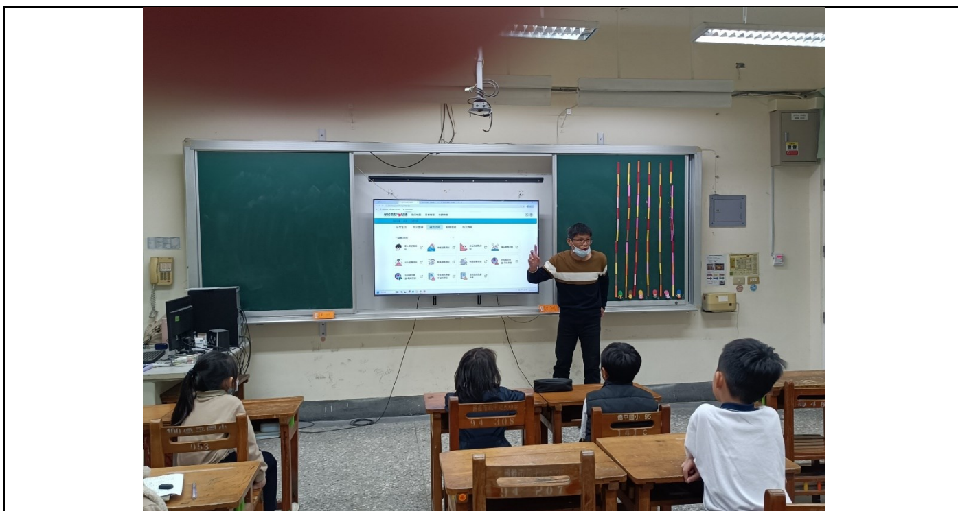
向學生介紹全民防災e點通(網頁版)各項災害應變須知