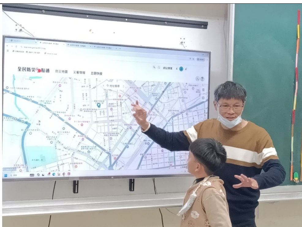
教導學生善用全民防災 e 點通資訊內容，強化防災、減災準備工作