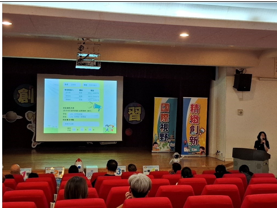
家庭防災卡填寫範例