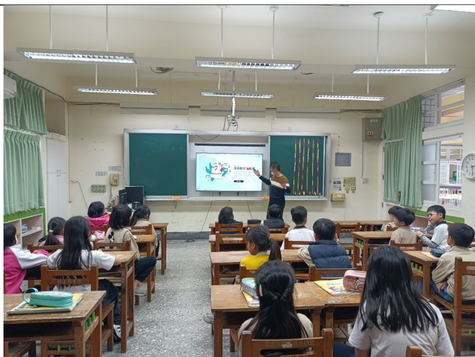
教導學生使用全民防災 e 點通(網頁版)