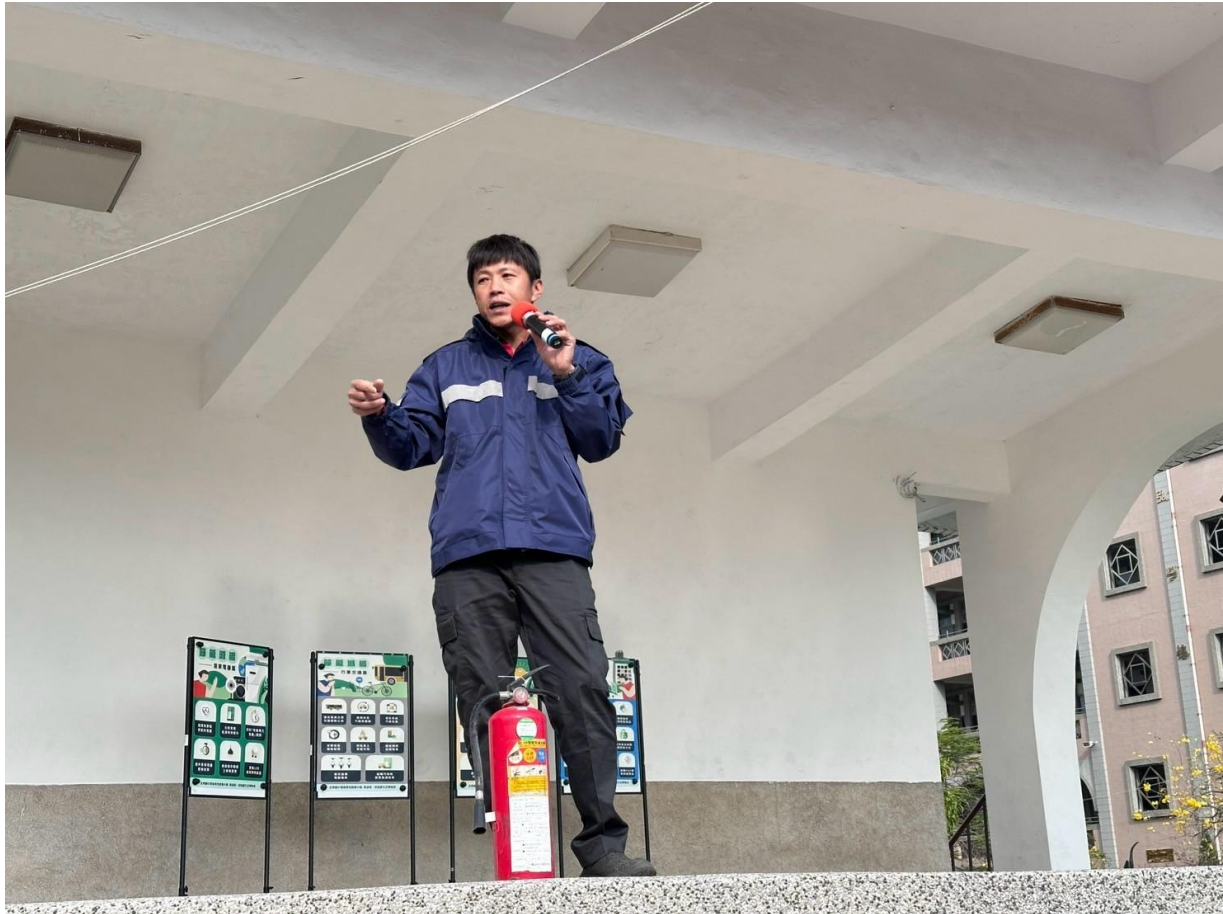
照片說明：消防隊至本校進行瓦斯安全宣導