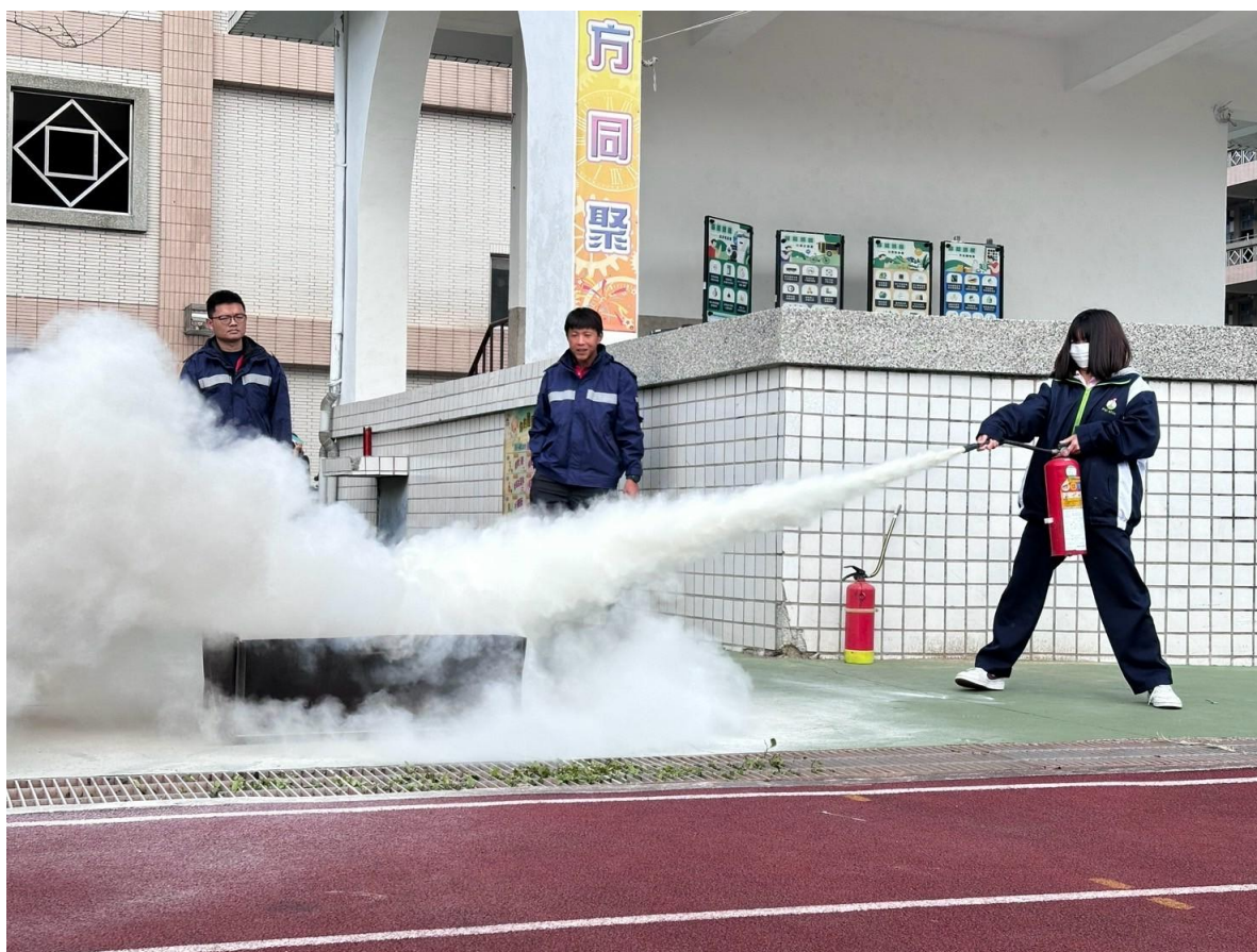
照片說明：消防隊至本校進行防火宣導及滅火器使用演練